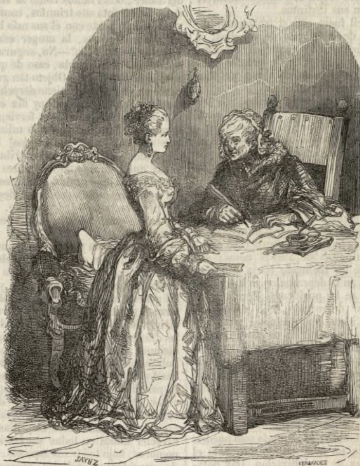
La vieja arrimó la mesa á su sillón, preparó el papel, cogió su pluma y esperó. (1)

chos años de no escitar hasta muy alto grado la atención pública, la llama hoy con preferencia á todos. En Eugenio Sue tenemos que contemplar el novelista de antes, cándido, sencillo, trivial á veces; y el novelista de ahora, enérgico, filósofo eminente, y poeta