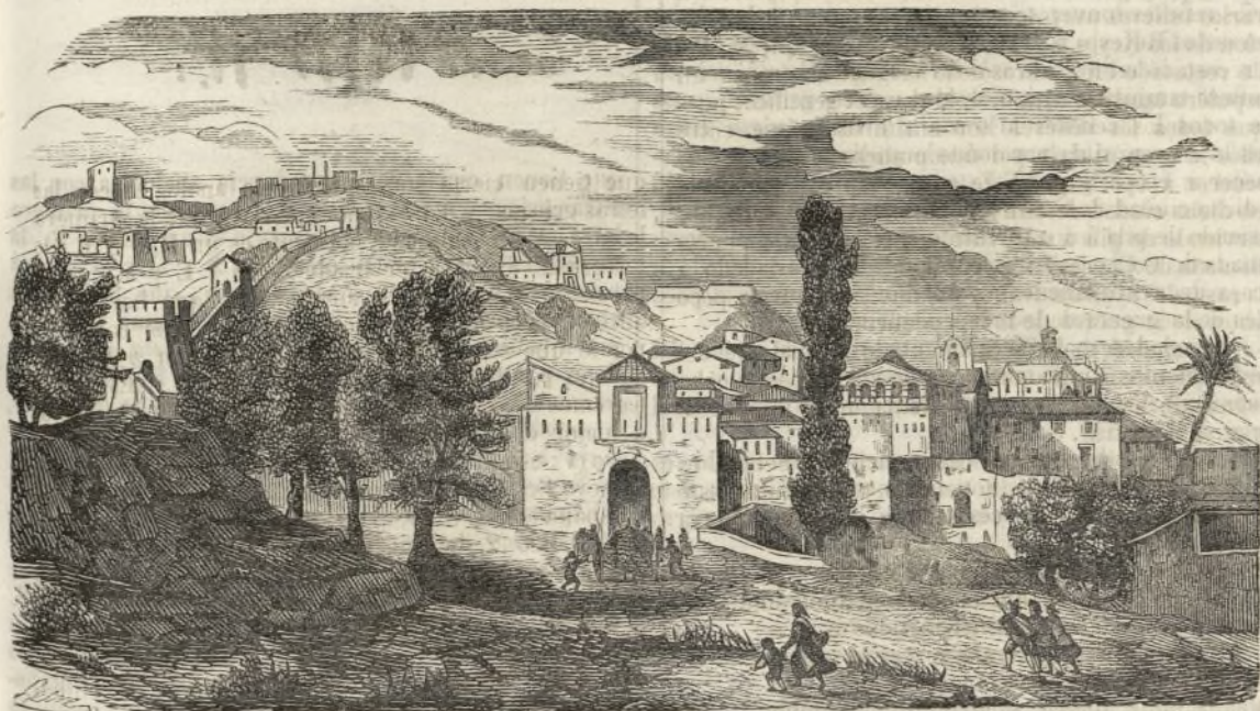
SAN FELIPE DE JATIBA.

SETABI pueblo antiguo de la Contestania,