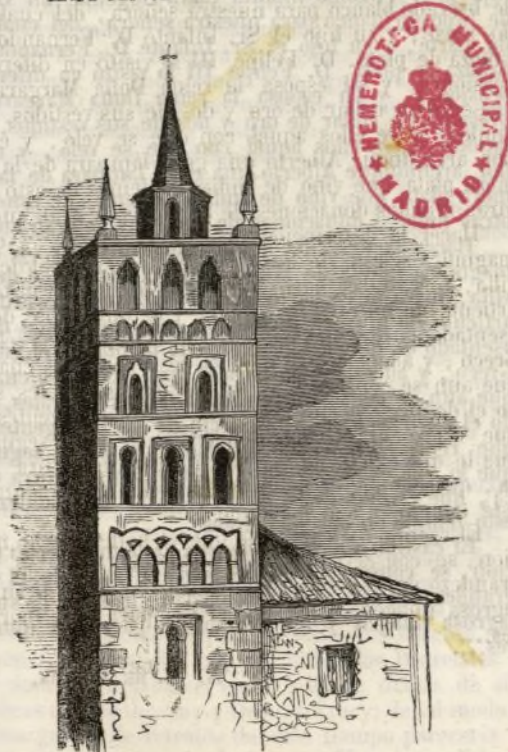
Torre árabe de la Iglesia de Sta. María en Illescas.