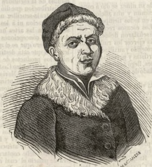
D. FELIPE DE CASTRO.

L a escultura como las demas bellas artes necesita para su mejor desempeño la construcción de algunas obras en las cuales se empuñe el buen nombre de una época y la reputación de los artistas de una nación. En los periodos de la historia de España donde los pertrechos de guerra y las exigencias turbulentas de la revolución imposibilitaron el libre ejercicio de las artes, no son numerosas las obras que pasaron a los tiempos venideros y por esta razón, no hubo en ellos un monumento que pueda llamar la atención de los inteligentes.