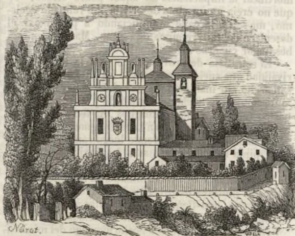
EL CONVENTO DE ATOCHA.