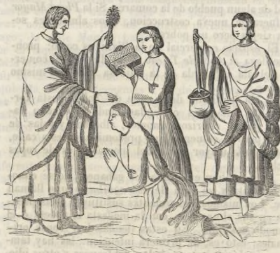
Apuntes para la historia de los trajes de España en los siglos XII, XIII, XIV, XV y siguientes.