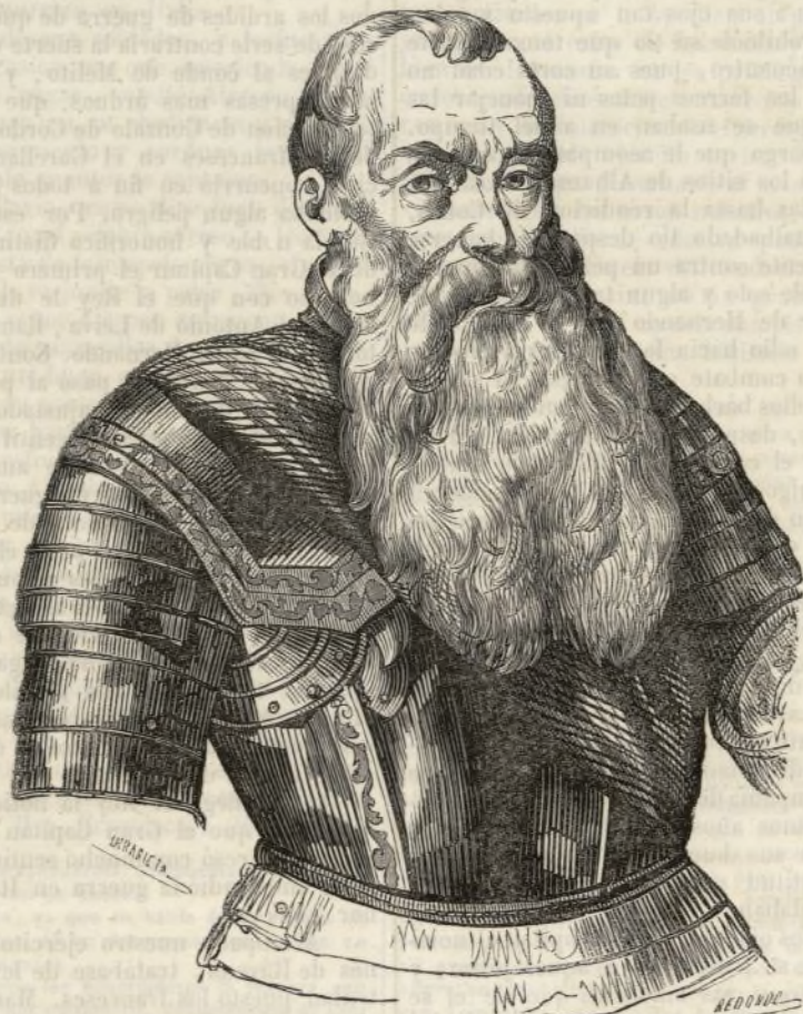
HERNANDO DE ALARCON.