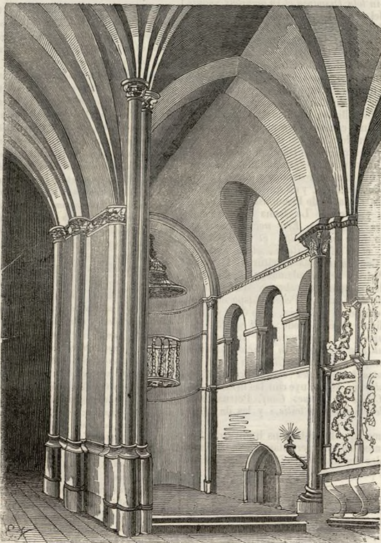
Vista del interior de San Cristobal.

Domingo, su propio monasterio de San Cristobal de Eneas , por el buen servicio que este abad les ha hecho á ellos, y promete hacer á Dios y en honor de San Cristobal. Con él donan otros monasterios sujetos al mismo, como San Adriano , junto al pueblo de Santa Cruz , San Vicente de Río Egiva , San Estevan en Ormaza de Fornillos , y otras propiedades, entre las cuales hay varias dependientes de aquellos monasterios. Nómbranse los pueblos en que se hallan unas y otros; pero los pasamos en silencio por no fastidiar