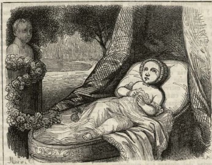
Niño en la cuna: pintado por D. Federico Madrado.

Otros jóvenes artistas de la grandiosa escuela que ha empezado á introducirse en la Academia, merced