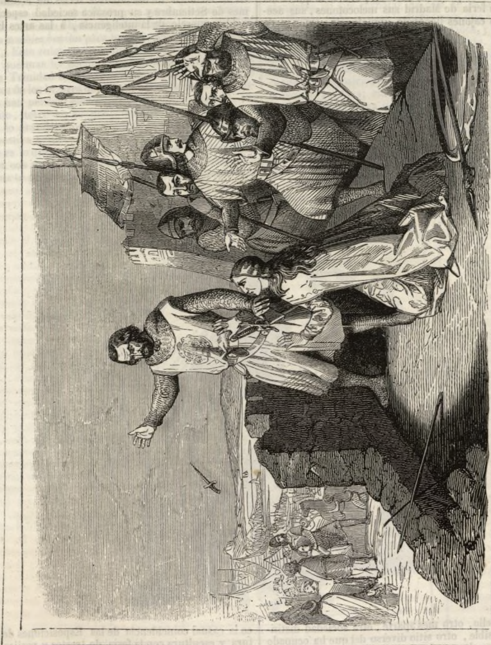
Guzmán el Bueno en el sitio de Tarifa. Cuadro del Sr. Utrera.