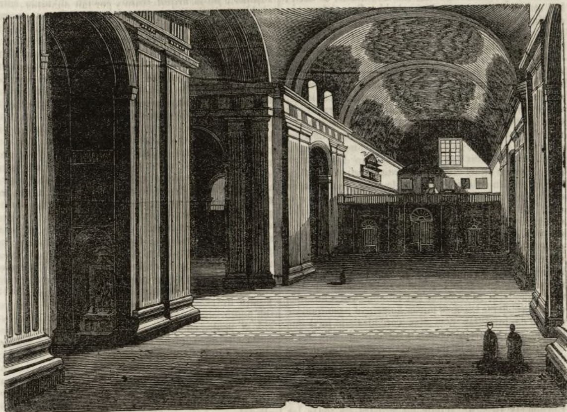
SAN LORENZO DEL ESCORIAL. (1)