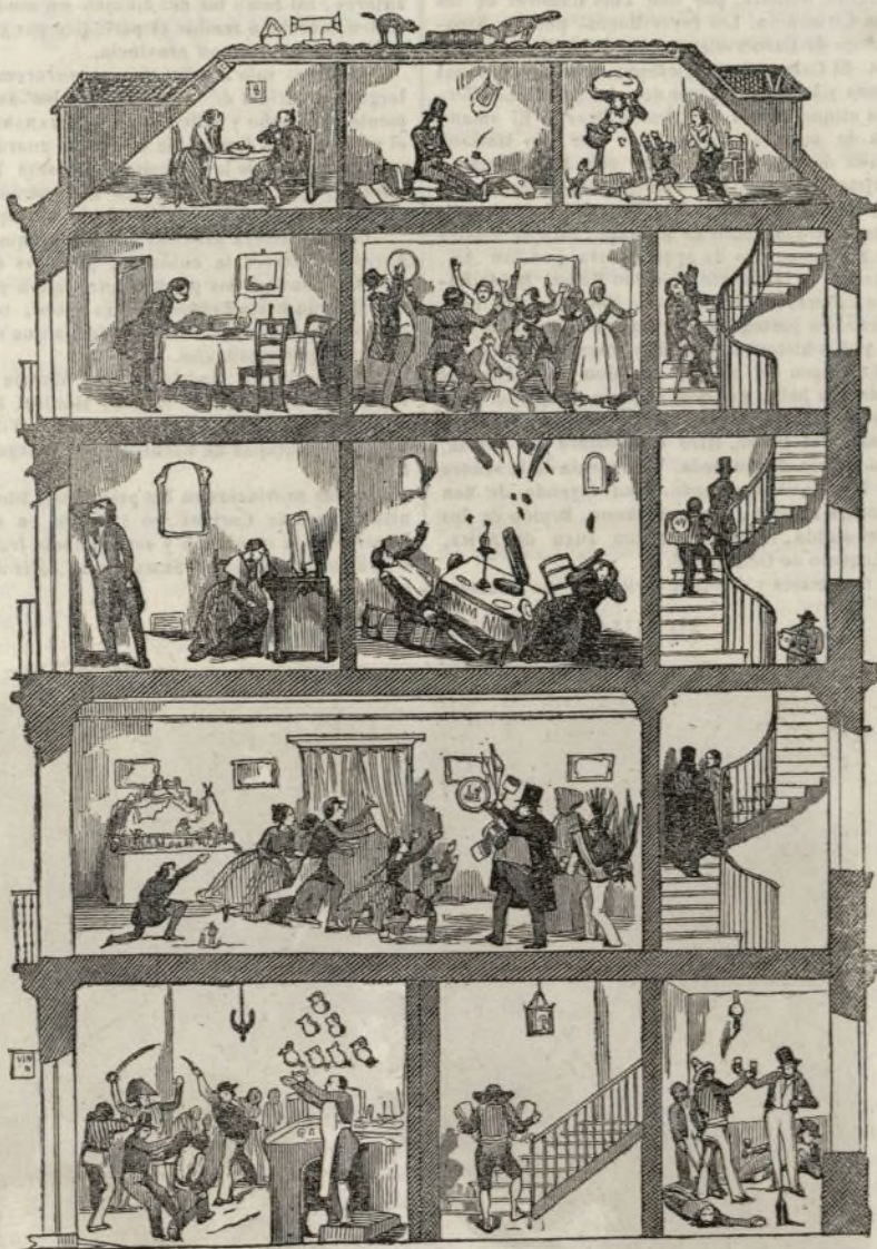
Los cinco pisos de una casa de Madrid la noche de Navidad.

Nuestros lectores han podido juzgar por el actual volumen, de los esfuerzos que hemos hecho para mejorar el SEMANARIO, enciclopedia popular por la instrucción, lectura de las familias por la amenidad y album sin rival en su género por la ilustración. Algun terreno llevamos ya andado, pero nos falta mucho que recorrer para llegar al punto á que aspira nuestra ambición; á fin de aproximarnos á él cuanto antes, tenemos ya adoptadas las medidas convenientes para que el tomo que vamos á comenzar, aventaje extraordinariamente á los anteriores en la variedad de materias, en la perfección de los dibujos, en el esmero de los grabados, en la calidad del papel, en la ejecución tipográfica y en la cantidad de lectura.