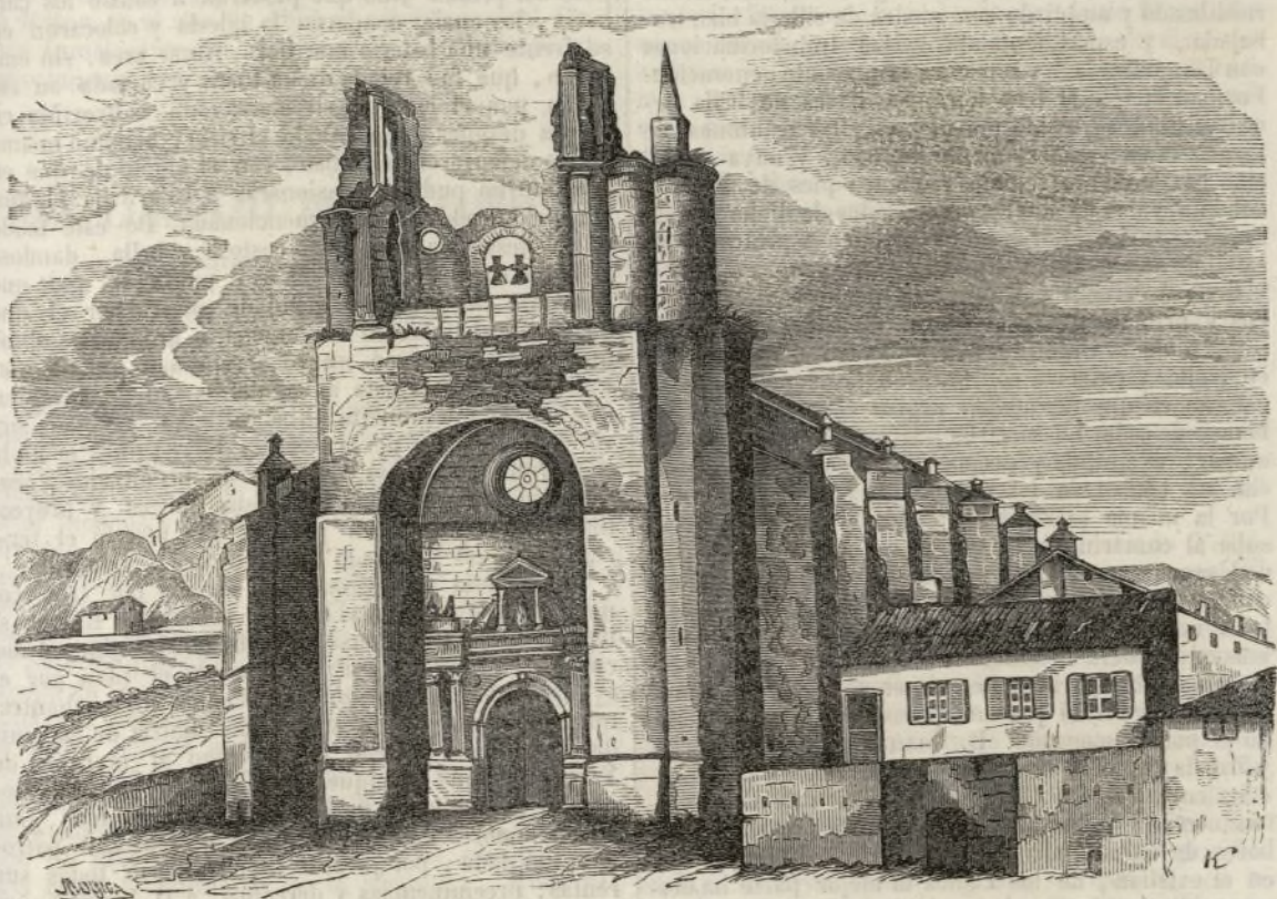
El Santuario de Begoña.