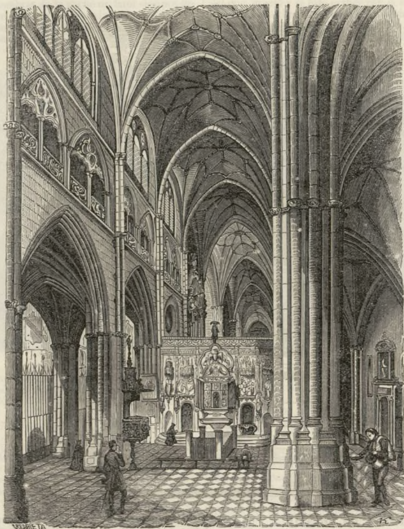
LA CATEDRAL DE PALENCIA.

Tesoro inagotable de riquezas artísticas, de admirables monumentos, es nuestro país. Llevamos algunos años dando á conocer las construcciones antiguas, perpetuando su recuerdo, sus copias, sus proporciones, para sorpresa de los siglos venideros, que dudarán tal vez de su existencia y los considerarán acaso como un sueño maravilloso de alguna imaginación poética; y cuando pudiera creerse agotada la materia, nos hallamos en la misma duda que al principio, sobre cual merece la preferencia de tantos y tan célebres, interesantes ó curiosos monumentos como reclaman nuestra atención, si hemos de continuar recorriendo la serie inmensa de los que contiene nuestra patria.