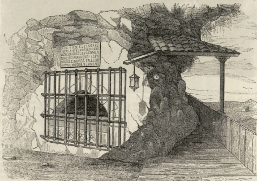
Gruta en que está la tumba de Pelayo.

descripcion del Santuario, colegiata y cueva de Covadonga. El SEMANARIO, en los primeros tiempos de su larga existencia, pagó ya, fiel á su dictado de ESPAÑOL, este tributo á las grandezas españolas. Vamos únicamente á hablar de la tumba de Pelayo. Ambrosio de Morales la describe así en su Viaje Santo . «En lo postrero de la iglesia, frontero al altar mayor, está una covacha alta hasta la cinta, y que entra como 12 pies, y lo mas es cueva natural con solo tener un arco liso de cantería á la entrada. En esta capilla ó pequeña cueva está una gran tumba de piedra, mas angosta de los pies que á la cabeza; el arca de una pieza, y la cubierta de otra: todo liso, sin ninguna labor ni letra. Esta dicen todos que es la sepultura del rey D. Pelayo.» Poco ha variado desde el reinado de Felipe II este lugar memorable. El arco de piedra que da entrada á la oscura gruta es una sencilla ojiva al estilo del siglo XIII. Está casi del todo cerrado con tabique y algunas piedras labreadas, fragmentos del antiguo templo, que parecen haber formado parte de una orla muy semejante á otras que se ven en las iglesias Bizantinas de Abamia y Villanueva, contemporáneas de Alfonso I. Hay ademas una gruesa reja de hierro que