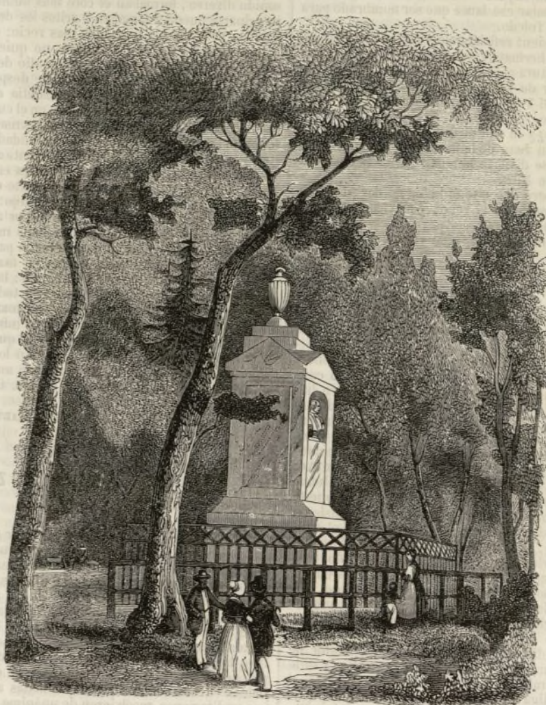
El sepulcro de Gesner.

muerte de Abel , que dió á luz en 1758, fué tres veces reimpresso en Francia en el trascurso de un año. Turgot tradujo dos cantos de su poema, el primer libro de los Idilios y El primer navegante . Diderot Los dos amigos de Narbona y las Conversaciones de un padre con sus hijos ; muchos poetas se declararon discípulos de Gesner. Griman, entre ellos, que en su correspondencia decia, convirtiéndose en eco de sus contemporáneos: «Gesner tiene una frescura y una dulzura de colorido encantadoras; un estilo gracioso y delicado, y una sensibilidad esquisita. Las obras de este poeta son admirables por el encanto que les es propio y por la moralidad que respiran; es un hecho que despues de leer sus Idilios es uno mejor que antes; tan cierto es que hasta los géneros mas frívolos en apariencia pueden contribuir á la reforma de las costumbres.» Gesner fué comparado á Hesíodo y Teócrito, y sus obras sirvieron de testo en los establecimientos de instruccion pública.