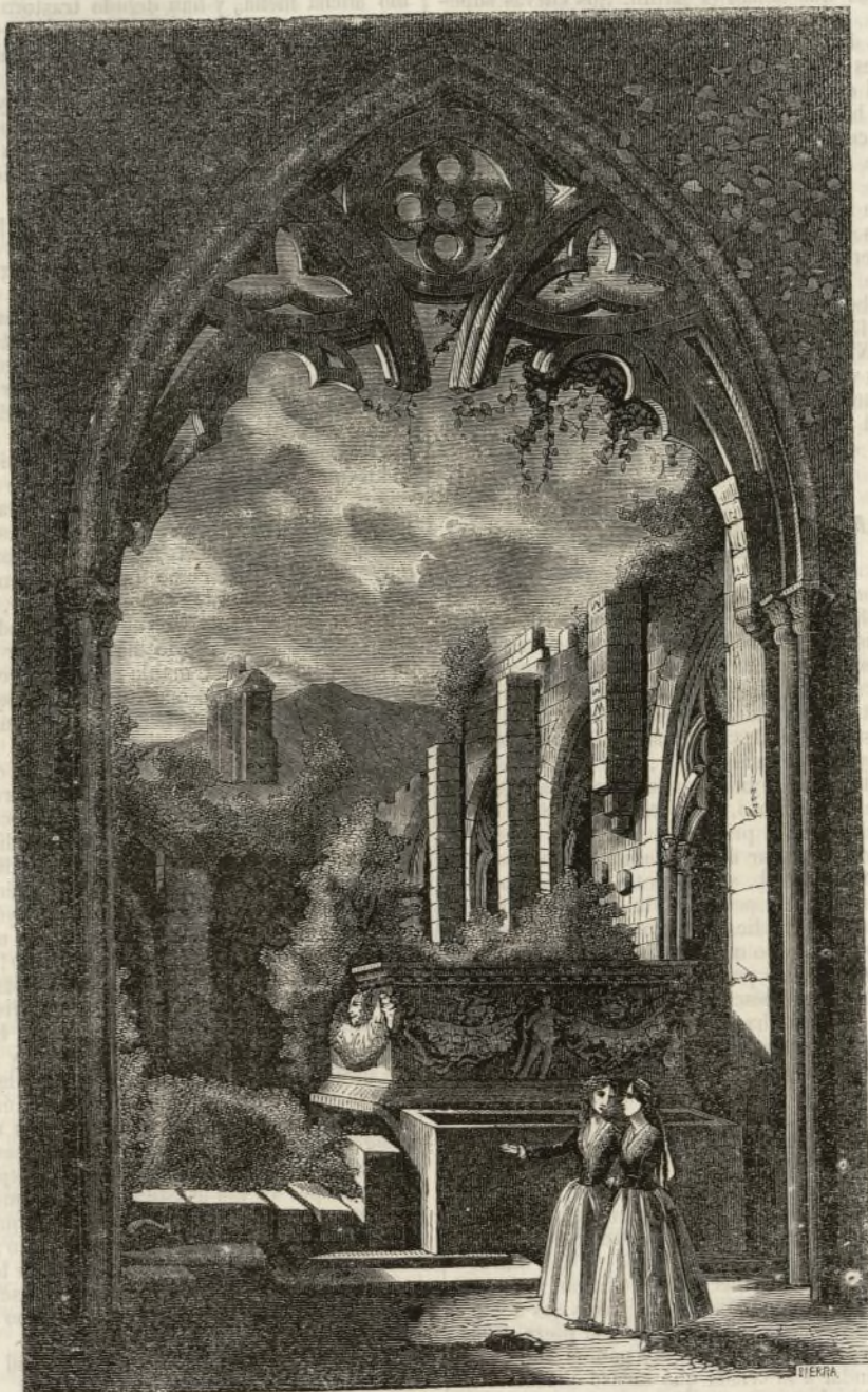
La Abadía de Lapaïs en la isla de Chipre.

Atravesando la garganta llamada de Lerine, después de haber salido de Agridi, se llega á una eminencia desde la cual se distingue la abadía de Lapaïs, fundada á mediados del siglo XIV por el rey Hugo IV de Lusignan para religiosos premostatenses, en medio de los cuales quiso aquel príncipe reposar después de su muerte. Encuéntrase el convento al borde de una plataforma destacada de la cadena de montañas que se extiende por aquel paraje. Bosques enteros de naranjos, de olivos, de laureles rosas, de acacias y de palmeras rodean el monasterio y la vecina aldea nombrada Cazaphani-Pano.