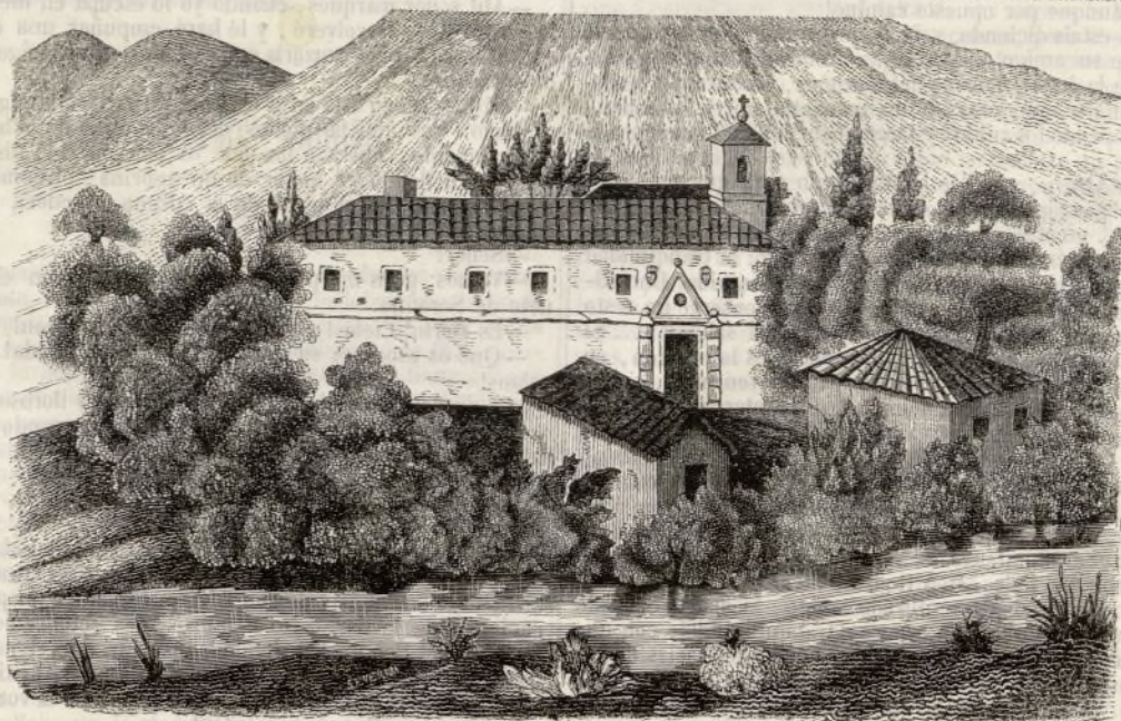
Vista de la iglesia de San Pedro de Villanueva.