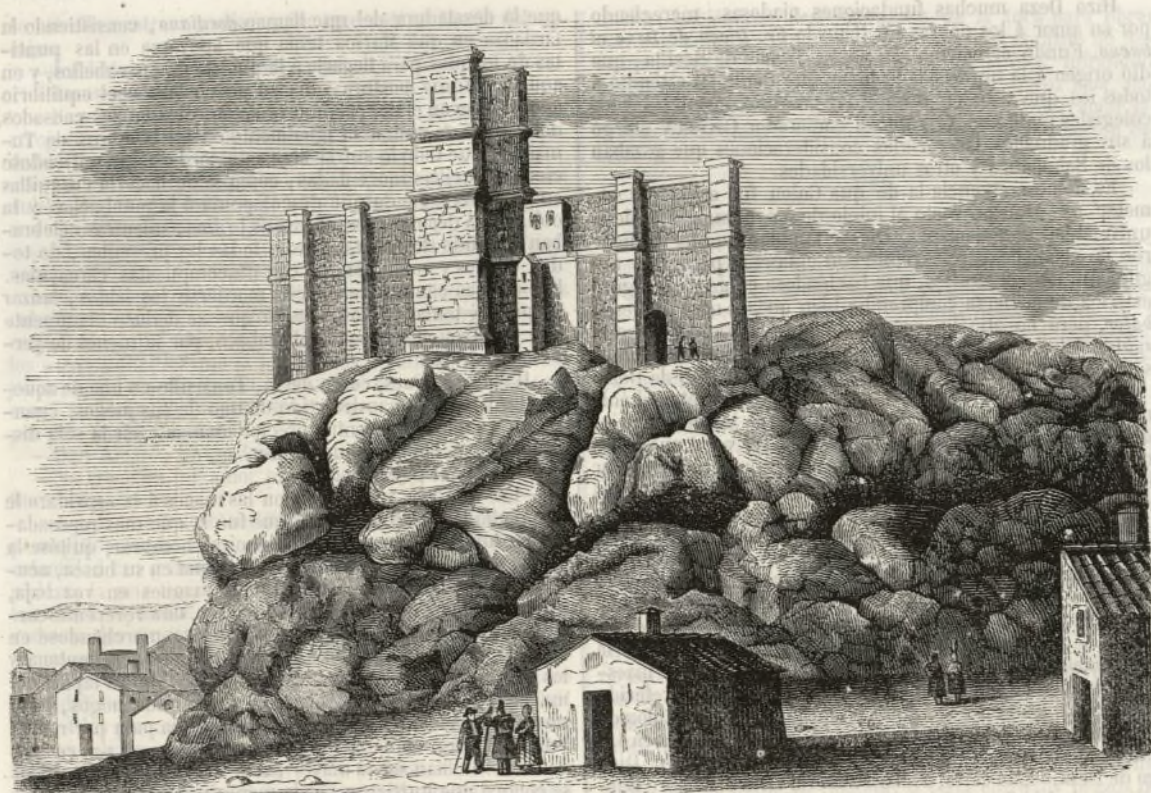
EL CASTILLO DE MONTEFRÍO.

La lámina que va al frente de este número, es una copia del hermoso castillo que se encuentra en la villa de Montefrío, población de Andalucía que cuenta unos 1800 vecinos. La vista de la fortaleza, cuya imponente masa se destaca sobre el azul del cielo en lo alto de la peña que la sirve de cimiento, está tomada desde la casa llamada del Pozo, en la calle titulada del Carmen. Aunque todavía se mantienen en pie los principales murallones de esta construcción antigua, el estado ruinoso en que se encuentra, hace esperar que antes de mucho la mano del tiempo podrá mas que la solidez con que la obra estaba construida, y no quedará de ella otro recuerdo que el que consignamos hoy en el SEMANARIO.