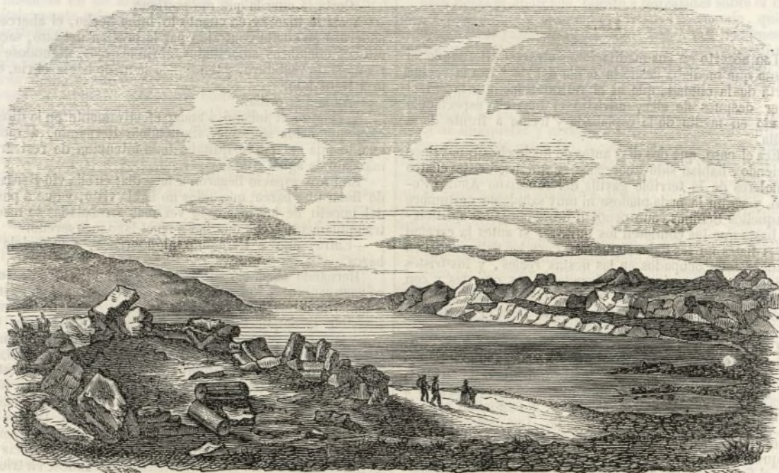
El mar Muerto.