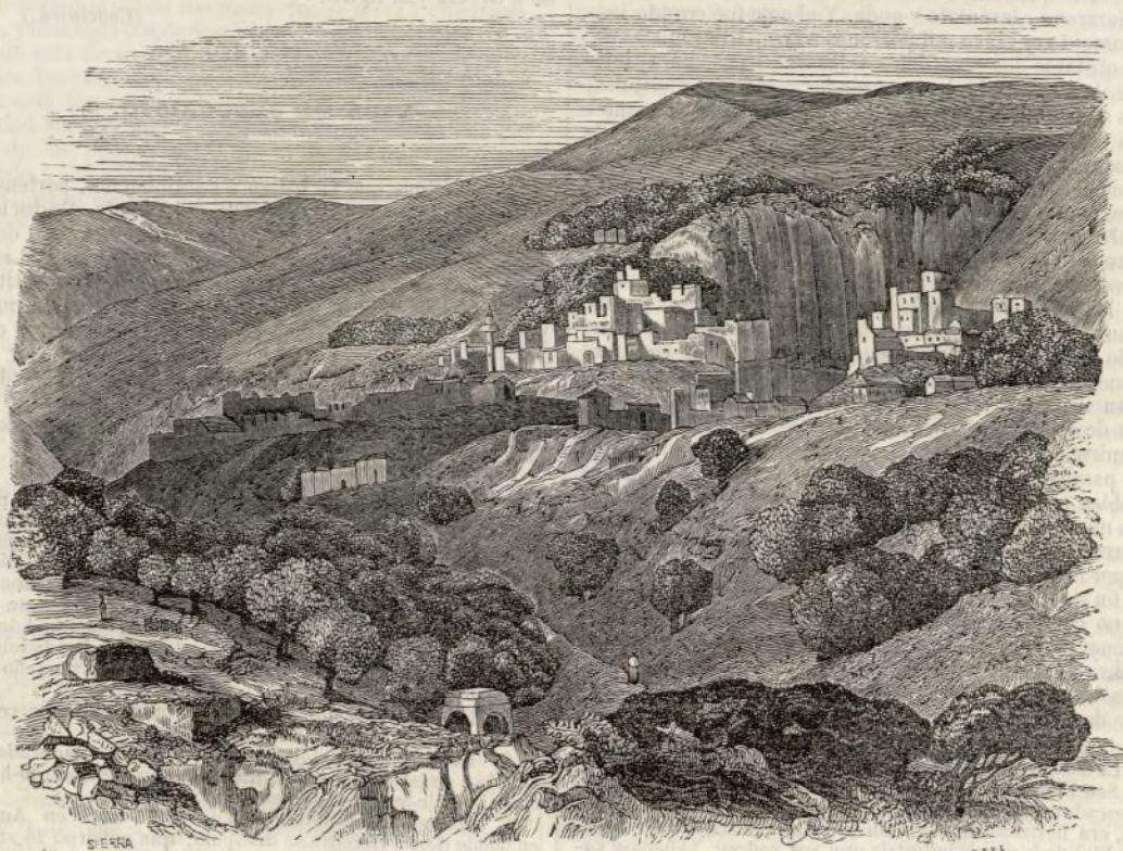
Vista de Nazareth.