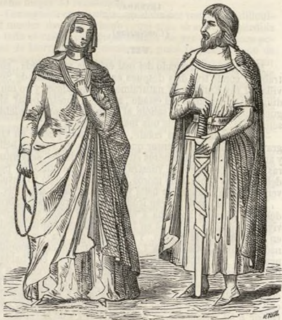
TRAJES DEL SIGLO XIII.

Dirección, Redacción y Oficinas calle de Jacometrezo, número 26.