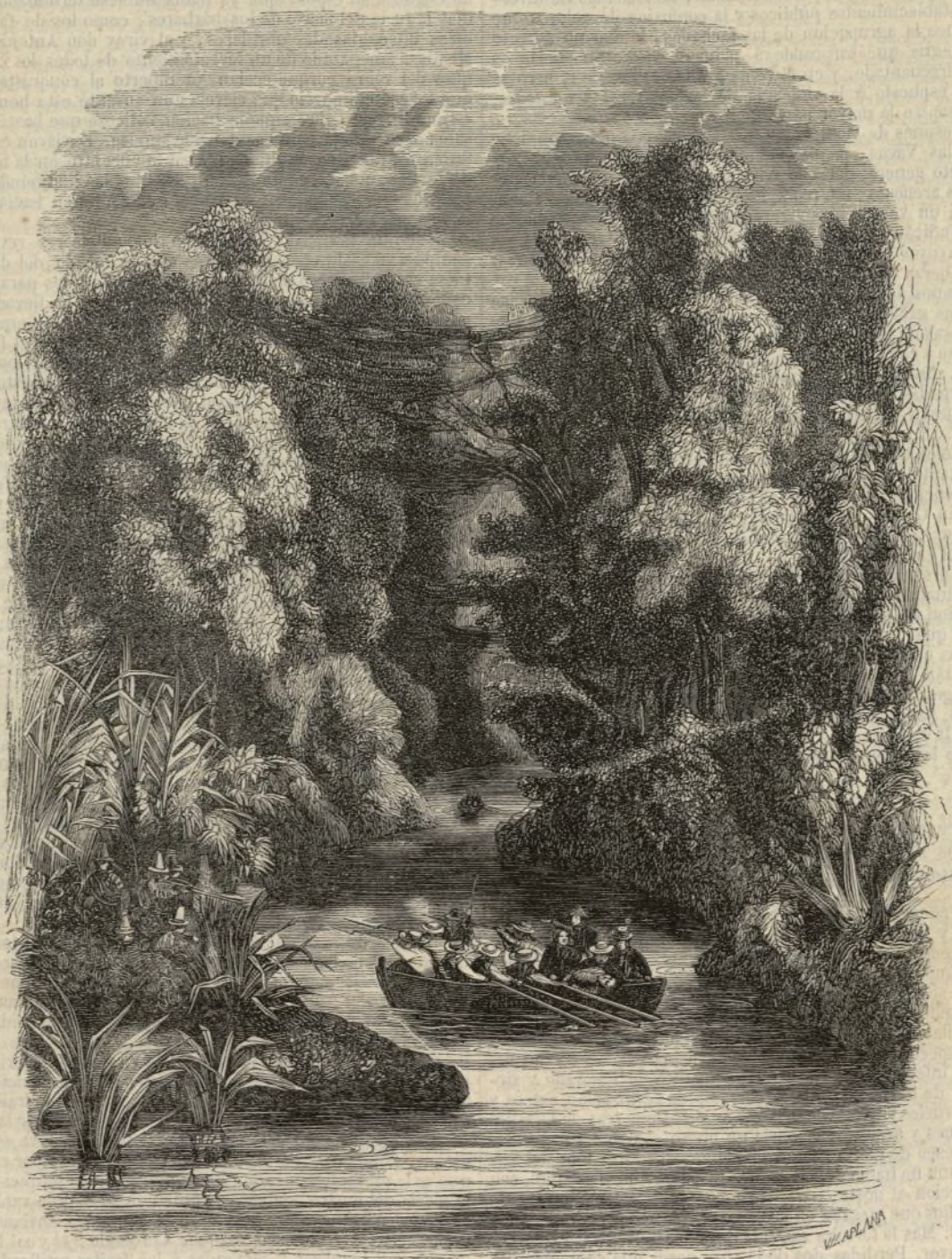
América del Sur: vista tomada en el arroyo del Rosario.