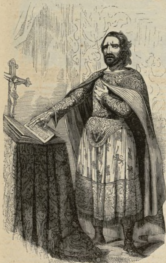
El Rey jurando.

Presentábase éste precedido de su comitiva, y revestido de las insignias reales; subía al trono con los infantes, quedando al pié sobre las gradas el gran canciller, el presidente y asistentes, los letrados y demas oficiales del acompañamiento: los notarios de las Cortes se acercaban á sus asientos, y todos permanecían en pié; el rey entonces mandaba cubrir á los concurrentes; pero al ir á tomar sus puestos levantábase contienda entre las ciudades sobre la preferencia de ellos: Toledo y Búrgos especialmente se los disputaban hasta haber llegado á resistir los mandatos del monarca, obligándole á bajar de su silla para quitar por su mano misma á los procuradores de la ciudad de Toledo... y poner á los de Búrgos diciendo: «deja ese lugar que todos dicen é así parece que los procuradores de Búrgos deben estar en él é non vosotros» esto ocasionaba protestas y la cuestion se renovaba al hablar y votar, hasta que nuestros principes decidieron que se diese la preferencia segun la calidad personal del procurador; mas tanto se repitieron las reclamaciones, que al cabo se designó á Toledo un sitio aislado en medio del local.