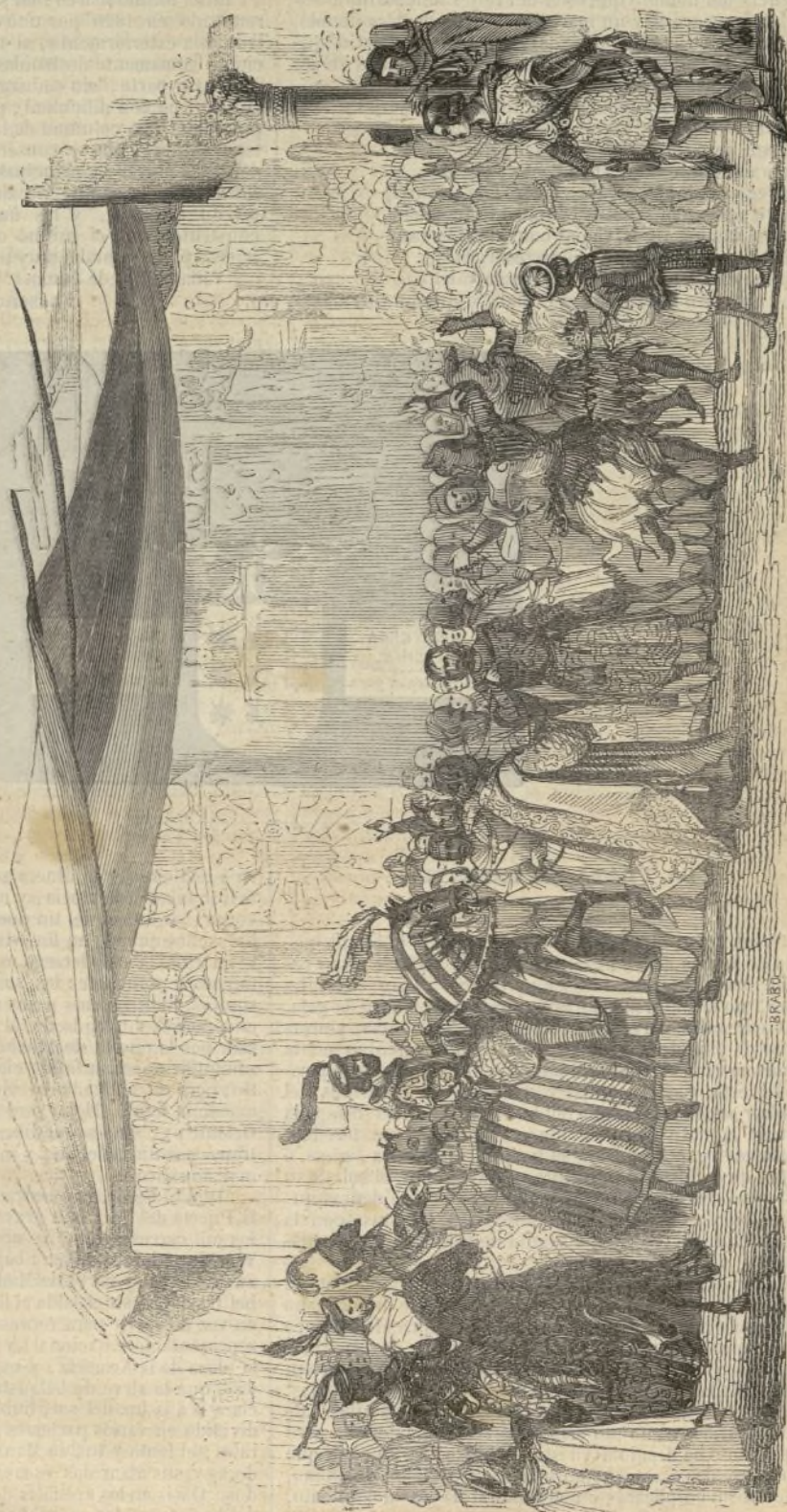
Comitiva del rey en la coronacion.

Uno de los monumentos célebres de la antigüedad, fué sin duda el monasterio de monges Benedictinos fundado en el siglo sétimo en san Roman de la Hornija, distante una legua de la ciudad de Toro, por los Reyes godos Chindasvinto y su esposa Recisverga, por consejo de san Fructuoso, primer Abad de él, y con el objeto de que sirviera para su enterramiento. Destruído hoy casi en su totalidad, solo se conserva parte de la Iglesia, y en ella una pequeña capilla con el sepulcro donde se hallan los restos mortales de los fundadores. En lo antiguo, y cuando ocupaba el medio de la nave mayor de la Iglesia, ostentaba magnificencia y grandeza: hoy esta en la capilla llamada del santo Cristo de la Red, sin otro recuerdo que el escudo y urna que representa la lámina. Unos tablo- nes dados toscamente de blanco, ocultan una gran urna de alabastro sencilla, que guarda las cenizas de los Reyes: sobre ella se vé un paño negro de vara y media de largo y una de ancho; en el centro un escudo con el fondo blanco, y en él nueve estrellas en tres órdenes; tres azules, tres blancas, y las tres restantes de uno y otro color, rematando en una corona al parecer ducal. A los la-