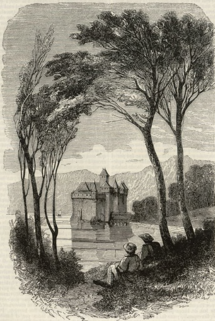
EL CASTILLO DE CHILLON.

El domingo anterior hicimos con nuestros lectores una ligera escursión por algunos puntos notables de la Suiza moderna; hoy volvemos á llamarles la atención sobre el mismo país, ofreciéndoles una linda vista del pintoresco castillo de Chillon, que ha servido de asunto á un poema de lord Byron y que es indudablemente uno de los paisajes mas deliciosos que puedan buscarse.