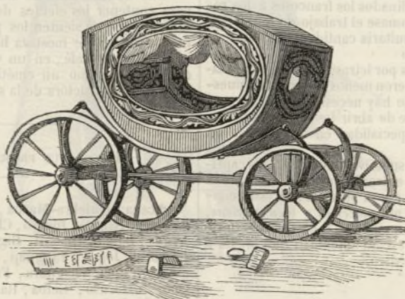
Coche de ceremonia en Constantinopla.

La carroza que ve el lector es copia de los carruajes que circulan por las calles de Constantinopla los días de fiesta y de ceremonia, sirviendo de vehículo á las señoras ricas. Es bien extraña y curiosa la forma de estos coches, exactamente reproducida en nuestro grabado.