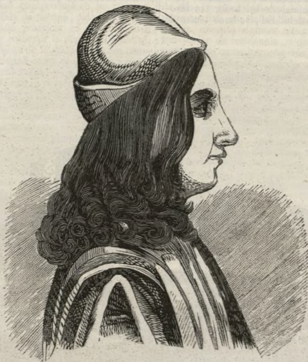
Retrato de La Mirandola.

¿Qué es lo que resta ya hoy dia de tanta erudicion, ciencia y fama? Nada, ó cuando mas muy poco. Y es que una gloria verdaderamente sólida no puede adoptarse sino á las ideas fecundas, á las creaciones nuevas del espíritu