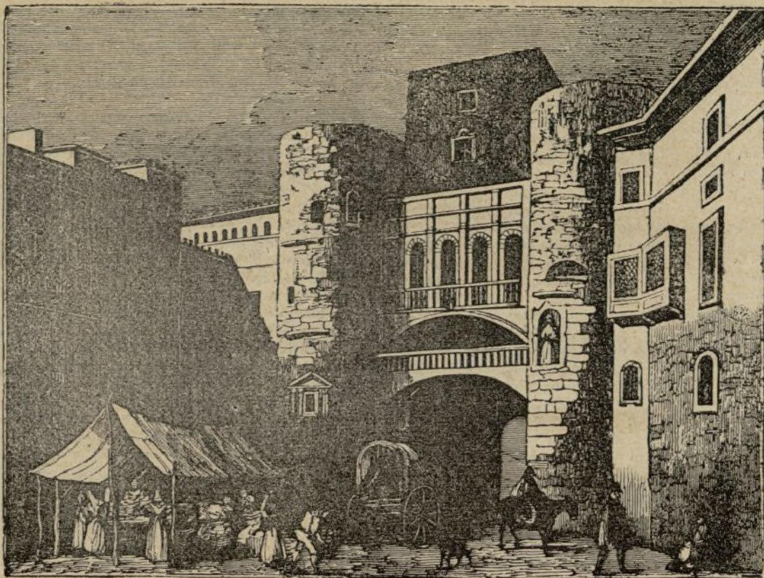
(Puerta antigua de Barcelona.)

Se suscribe al Semanario en las librerías de la viuda de Jordan é hijos , calle de Carretas, y de la viuda de Paz , calle Mayor frente á las gradas. Precio 4 rs. al mes, 20 por seis meses, y 36 por un año. En las provincias en las principales librerías y administraciones de correos con el aumento de porte.