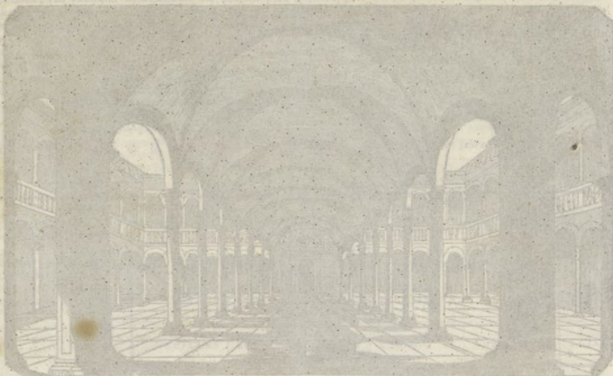
CRISTIANO DEL HOSPITAL DE ALFAR DE TOLEDO