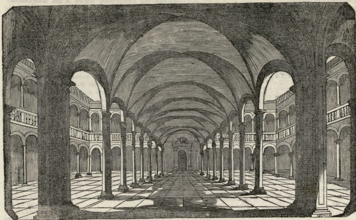
CLAUSTRO DEL HOSPITAL DE AFUERA DE TOLEDO.