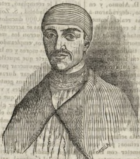
EL GRAN CARDENAL DE ESPAÑA.

La vida y memorables acciones del gran cardenal de España D. PEDRO GONZALEZ DE MENDOZA es una de las páginas ilustres que deben consultarse en nuestra historia nacional. Como gran político é influyente, durante el reinado de los Reyes Católicos, y por cuya mano pasaron casi todos los negocios de algun interés é importancia, está su historia enlazada con la de la monarquía; y como hombre benéfico y religioso, numerosos monumentos y piadosas fundaciones atestiguan en mil partes la grandeza de su alma y su genio emprendedor. Llamado por antonomasia el Gran cardenal de España , fue respetado y hasta temido, aun de los mismos monarcas; y sus inmensas riquezas, numerosas dignidades y bien merecido prestigio, le colocaron en los puestos mas brillantes y eminentes; tanto, que Pedro Martín de Angleira le llama á cada paso tercero rey de España .