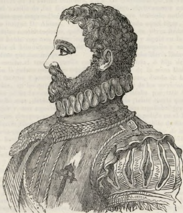
DON ALONSO DE ERCILLA Y ZÚÑIGA.