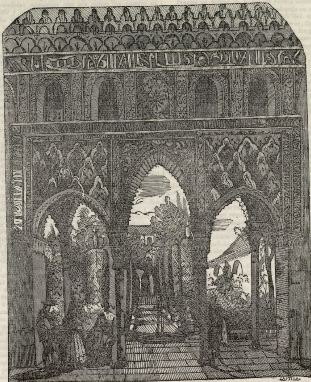
JARDIN DE EL GENERALIFE.