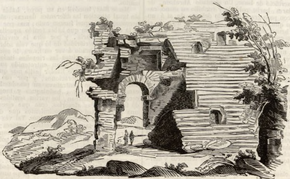
Fragmento de las ruinas de Sagunto.