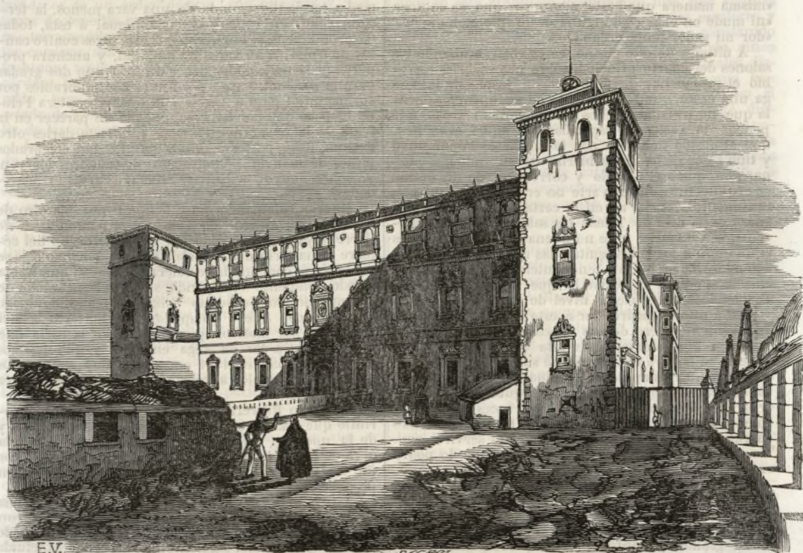
EL ALCAZAR DE TOLEDO.