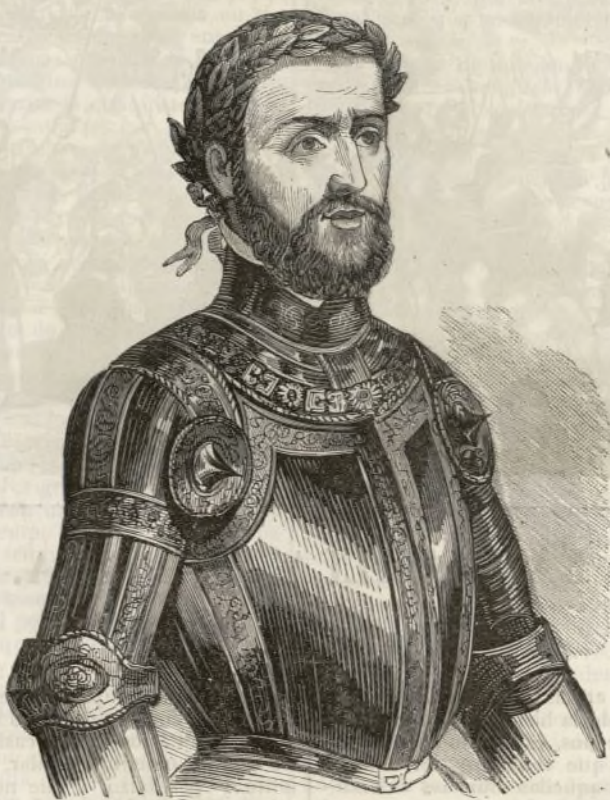
El Emperador Carlos V.

derico de Bozulo: de allí el ejército del Emperador vino alojar á vista del ejército del Rey de Francia pensando que salieran á la batalla como había prometido hacer; pero el Rey retrajo su ejército dentro del parco de Pavia: y aunque tenía mas gente que los nuestros no quiso salir á la batalla creyendo que los nuestros no le osáran acometer en su fuerte, y que entre tanto no pudiendo entretener el ejército por falta de dineros, de que sabía estaban harto mal proveidos, serian forzados de hacerlo, y él saldria con su empresa, no solamente de Lombardia mas del reino de Nápoles donde había enviado al duque de Albania con seis mil infantes y cuatrocientas lanzas gruesas allende de la gente que los vecinos para aquella em-