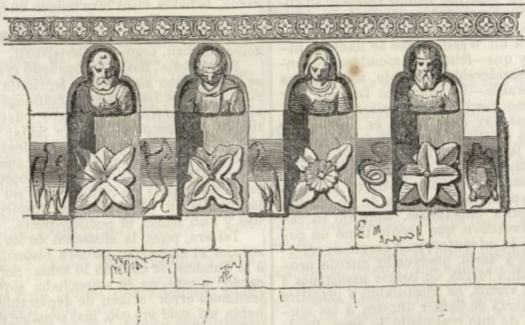
Cornisamento general de la iglesia de San Martin (Siglo XI.)