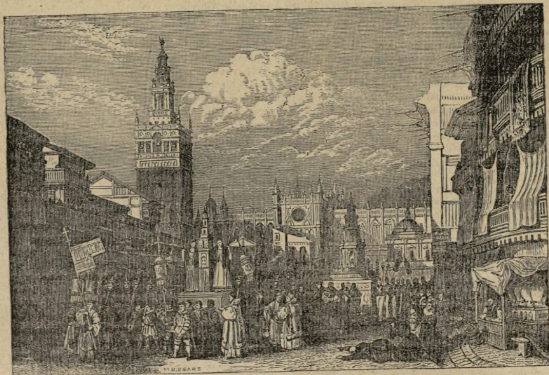
LA PROCESION DEL CORPUS EN SEVILLA.

NOTA. El grabado que antecede corresponde al artículo que se publicó en el Semanario en igual día del año pasado, descriptivo de la procesion del Corpus en Sevilla.