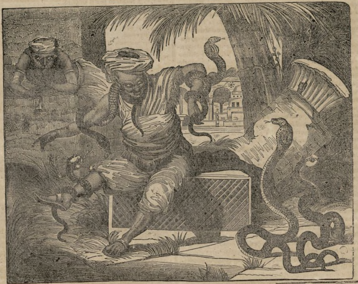
ENCANTADORES DE CULEBRAS.

H AY varios pasajes en las santas escrituras que aluden claramente á la opinion prevaleciente en las Indias Orientales desde tiempo inmemorial de que las serpientes son susceptibles de mansedumbre, perdiendo por medio de encantamientos toda su malignidad. En el salmo 58 hallamos un testo muy notable sobre este particular, en el que David compara á los malvados, diciendo: "El furor de ellos es semejante al de la serpiente: como el del aspid sordo y que tapa sus orejas. Que no oirá la voz de encantadores ni del hechicero que encanta diestramente." Y en el cap. 8 de Jeremías está escrito: — "Porque he aquí que yo os enviaré serpientes basiliscos para los cuales no hay encantamiento."