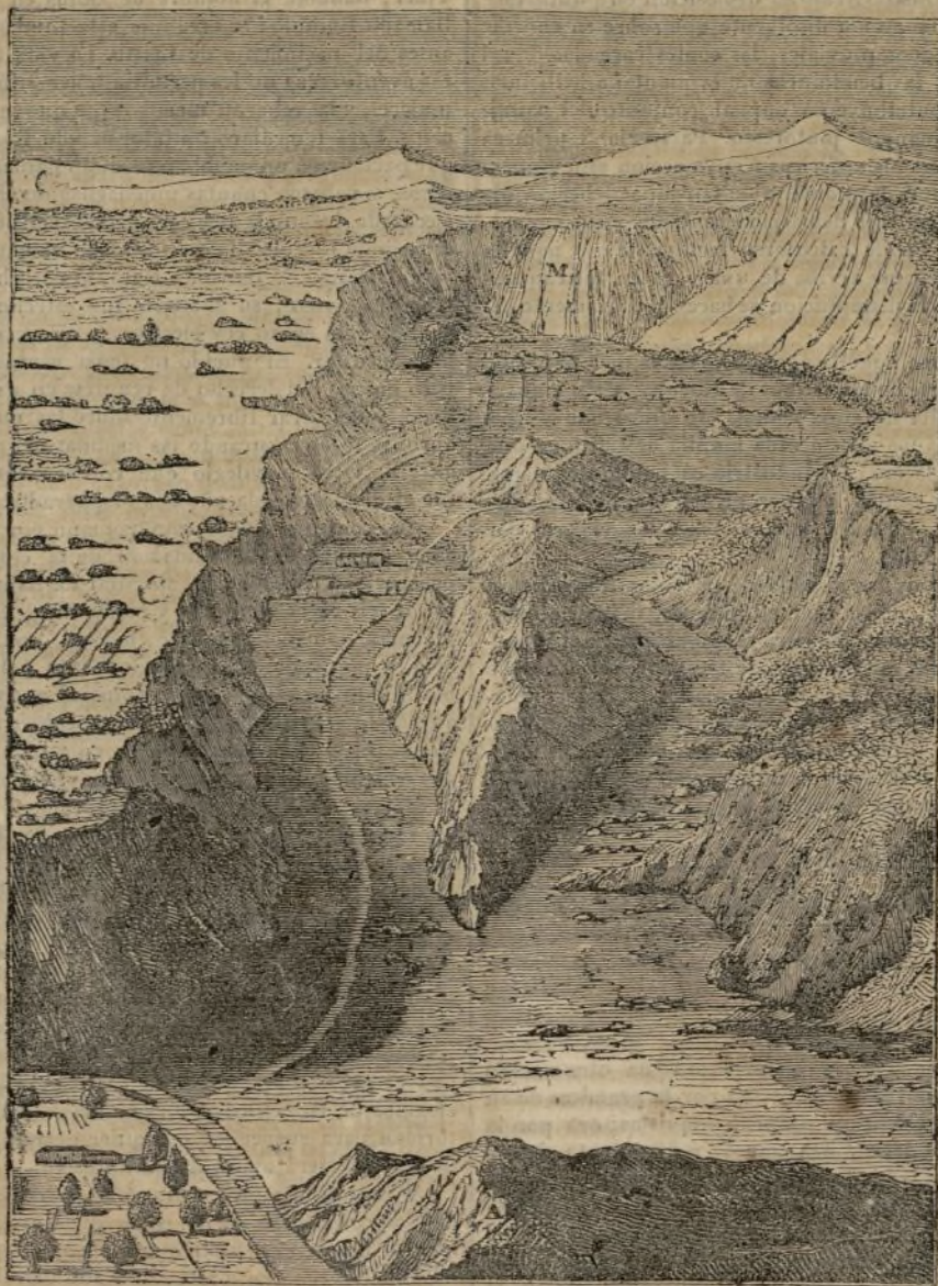
MONTAÑA DE SAL EN CARDONA.

E l viajero que de vuelta de Francia se dirija á Barcelona por el camino de Urgel, despues de haber atravesado entre Solsona y Manresa por un hermoso bosque de encinas y avellanos descubrirá repentinamente sobre una eminencia la pintoresca ciudad de Cardona; á una legua de distancia de la cual está situada la mas extraordinaria mina de sal gema que se conoce. El derecho de explotarla está concedido al duque de Medinaceli, mediante una crecida suma, y doscientos operarios se ocupan diariamente en estraer la sal, para lo cual la cortan en enormes trozos que colocan unos sobre otros en forma de pirámides. La mina se compone de ocho capas que unidas forman un total de quince varas, separadas unas de otras por capas de tierra arcillosa. Por medio de aquella, atraviesa un arroyo de agua cristalina, el que por espacio de algunas leguas y hasta su reunion