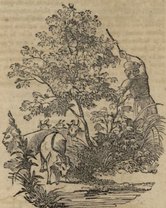
(Algodonero árbol, Gossypium arboreum .)

La especie anual es la mas generalizada, la que mas provision dá á las fábricas: se la cree orijinaria de Persia, de donde habrá pasado á Siria, al Asia menor, y á diferentes comarcas de la Europa meridional. El nuevo mundo se ha apresurado tambien á adquirirla, aunque no carecia de especies indigenas: entre estas se cita una cuyo fruto es mucho mas grueso que el del algodon asiático, de suerte que su cultivo seria mas productivo. Pero el algodonero de gruesas cápsulas es originario de las comarcas mas cálidas de la Europa meridional, mientras que el asiático se acomoda muy bien á la temperatura de Malta, de Sicilia y de Andalucía. Por eso los habitantes de los Estados Unidos le han dado la preferencia, y el éxito en su cultivo prueba evidentemente su acierto en la eleccion.