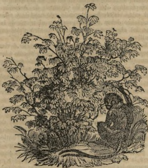
(Algodonero arbusto, Gossypium religiosum )

La denominacion de esta especie es en rigor un poco fastuosa, porque pudiera muy bien contentarse con el nombre de arbusto un vegetal que raras veces se eleva á gran altura. Sin embargo le someten á la poda, ya á fin de aumentar en producto, ya tambien con el objeto de dar á las plantas una forma y dimensiones que hagan mas facil la recoleccion. En estos algodoneros las hojas son palmeadas y divididas en cinco lóbulos prolongados: las flores son bastante crecidas, y su color rojo pardusco. De esta especie se hallan en el antiguo y el nuevo continente, y no es facil indagar si ha pasado de uno al otro; lo cierto es que la especie mas alta de algodoneros existia en América antes de la llegada de los europeos, y esto inclina á creerla como indigena del Nuevo Mundo; pero sus caracteres especificos se diferencian tan poco de los del algodonero arborescente de las Indias Orientales, que los botánicos no pueden menos de reconocerlos como de una misma especie.