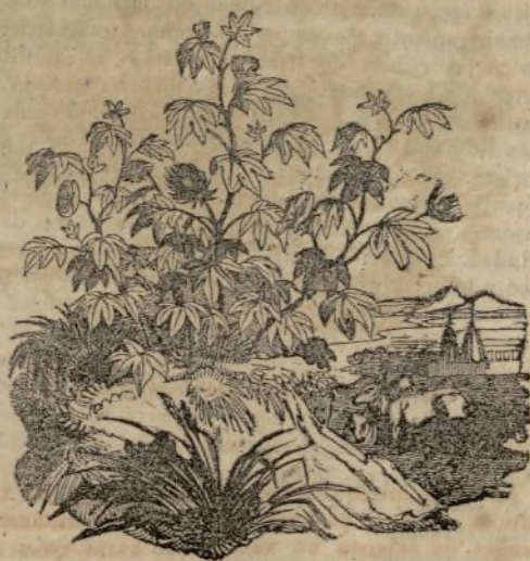
(Algodonero herbáceo, gossypium herbaceum .)

Aun cuando esta planta se halla clasificada entre las yerbas, su tallo es duro y leñoso: se la cultiva como una planta anual, pero duraria algunos años si se la entregase á la naturaleza. El tronco es cilindrico, rojizo ó pardusco en la parte inferior, velludo y matizado de puntitos negros en la parte superior como en los pediculos que superan las hojas de cinco lóbulos redondos y terminados en punta. Las hojitas del caliz son anchas, recortadas y muy dentadas: la flor es grande y amarilla, y los granos blancos.