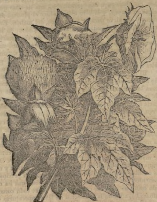
(Hojas, flores y frutos del algodón.)

Los algodones arbustos no están en plena acción mas que de cinco á seis años. Cuando el producto empieza á disminuir, es preciso hacer una nueva sementera á fin de renovar la plantación.