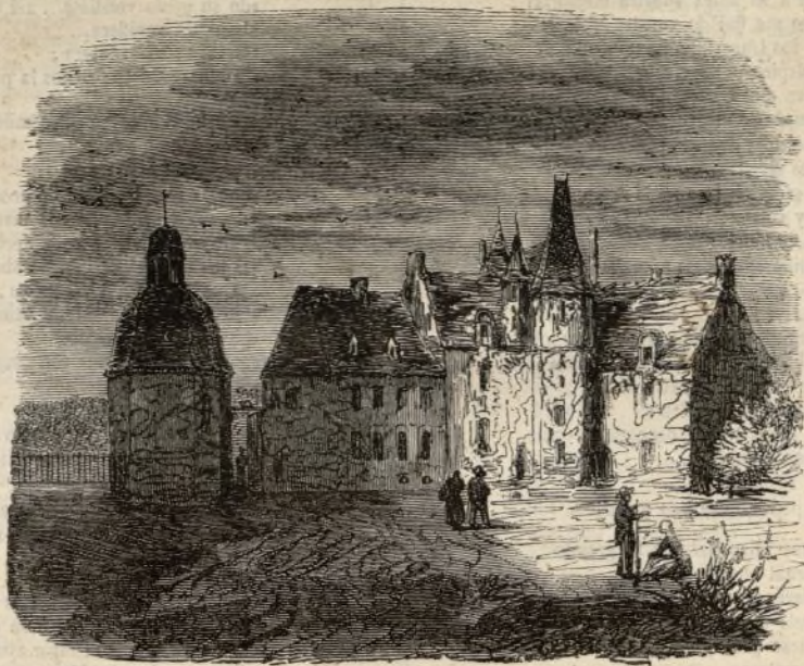
Castillo de las Rocas.

Siguiendo este ejemplo Numa Pompilio, luego que comenzó á gobernar á los romanos, puso toda su mira en edificar templos, instituir sacerdotes, dar ritos y ofrecer sacrificios con que redujo al pueblo á la piedad; de modo que la fé y el juramento eran suficientes para regirlo.