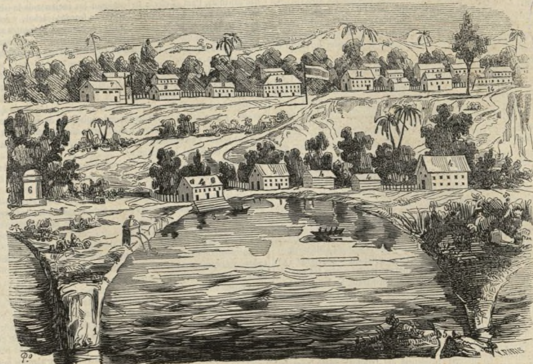
Vista de la isla de Fernando Póo.