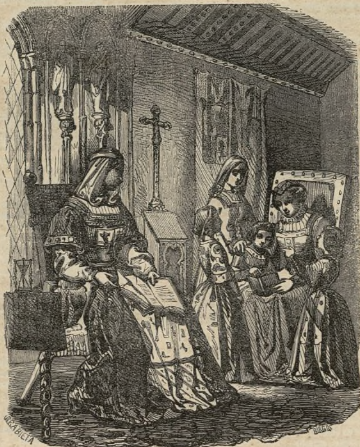
Doña Isabel Galindo (la latina) dando leccion á Isabel la Católica.