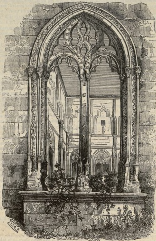
(Toledo.—Una de las ventanas del claustro de S. Juan de los Reyes.)