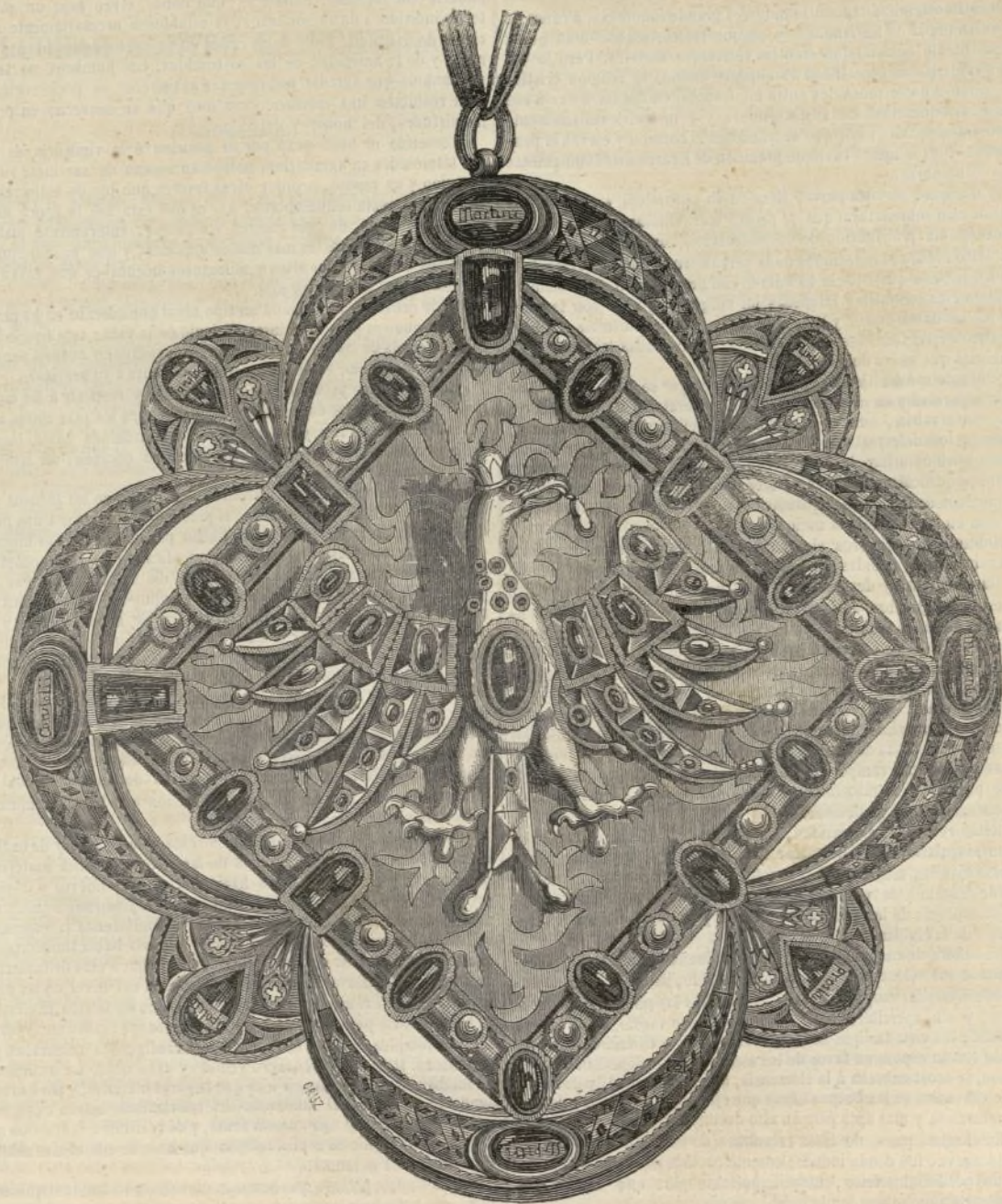
PLACA DEL EMPERADOR CARLOS V.

Esta alhaja histórica, cuyas dimensiones reproduce exactamente nuestro grabado, está cubierta de piedras preciosas. En la parte inferior del cuello del águila austriaca y sobre el vientre son rubies: las alas están adornadas también de rubies y de piedras encarnadas. En medio de la corona tiene una gran perla y algunas otras suspendidas del pico, de las patas y de la cola. Un rombo aislado y enriquecido con perlas, zafiros, amatistas y esmeraldas sirve de guarnición al águila. Los semicírculos que sirven de orla al rombo están esmaltados de blanco, verde y encarnado. En el fondo de ocho relicarios protegidos por cristales, y que contienen pedacitos de hueso, se leen los nombres de ocho santos y santas: Martín, Andrés, Margarita, Nicolás, Pedro, Hipólito, Constanza y Lorenzo.