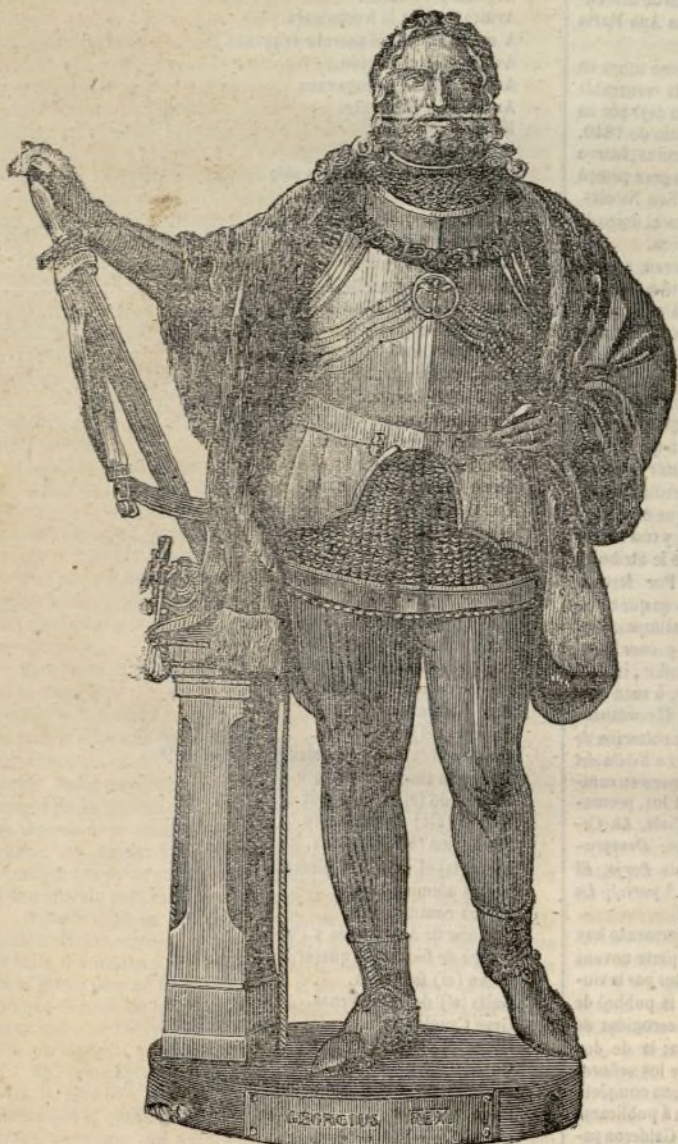
Jorge de Podiebrad, rey de Bohemia.

Para vencer amor querer vencerle. Peor está que estaba. Pintor (el) de su deshonra. Postrer (el) duelo de España. Principe (el) constante. Primero soy yo. Puente (la) de Mantible. Purgatorio (el) de Patricio. Púrpura (la) de la rosa. ¿Cuales mayor perfeccion? Saber del mal y del bien. Sacrificio (el) de Ifigenia. San Francisco de Borja. Secreto (el) á voces. Segundo (el) Escipion. Señora (la) y la criada. Sibila (la) del Oriente. Sitio (el) de Bredá. Tambien hay duelo en las damas. Tres (los) mayores prodigios. Tres (los) afectos de amor. Tres (las) justicias en una. Triunfo (el) de la Cruz. Un castigo en tres venganzas. Zéfiro y Pocris. Zelos aun del aire matan.