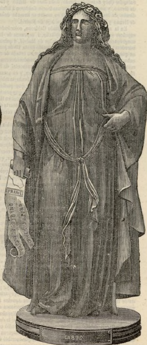
Libusa, reina de Bohemia.