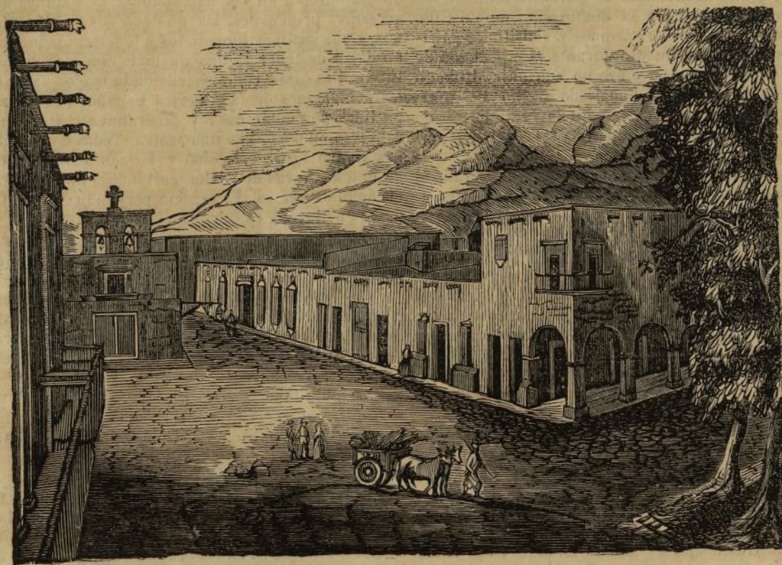
(Vista general de Tepic.)