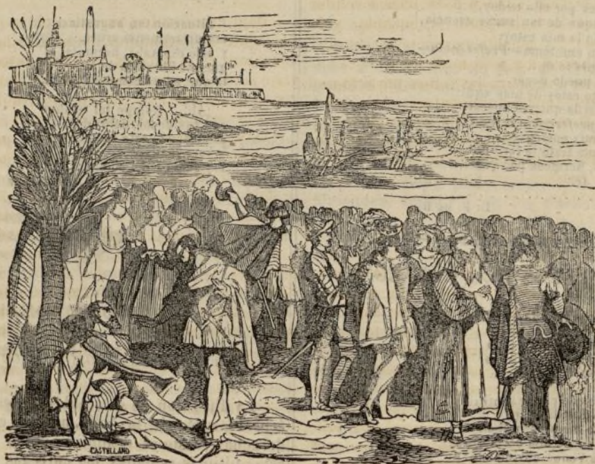
(Preparan los Españoles su expedicion para la conquista de Méjico.)