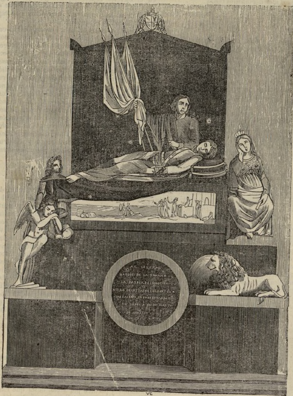
(Sepulcro del Marqués de la Romana.)