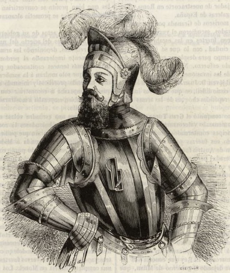
D. LUIS DE REQUESENS.