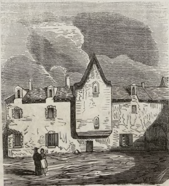
(Casa de Descartes.)

los conocimientos humanos, cuando su boca, su pluma repetía:—«Las preocupaciones son la única causa de los errores.» Renato Descartes vió la luz primera el 30 de Marzo de 1596, y fué bautizado en San Jorge del Haya el 3 de Abril. Pocos dias despues de su nacimiento tuvo