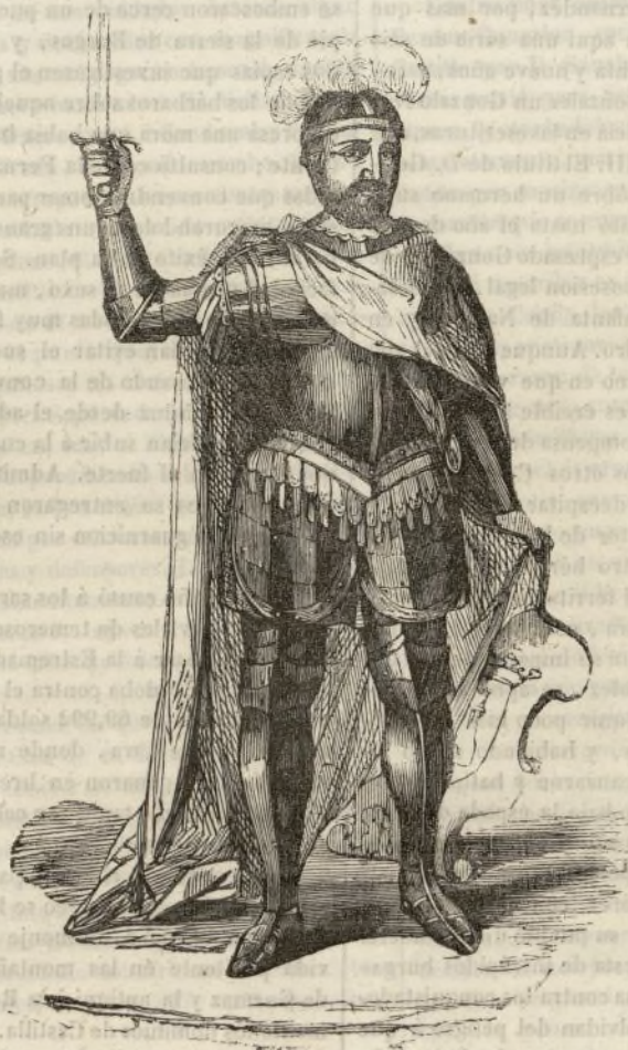
EL CONDE FERNAN GONZALEZ.

ED aquí un héroe cristiano inmortalizado por los hombres. En vano es que se atravesase el inmenso