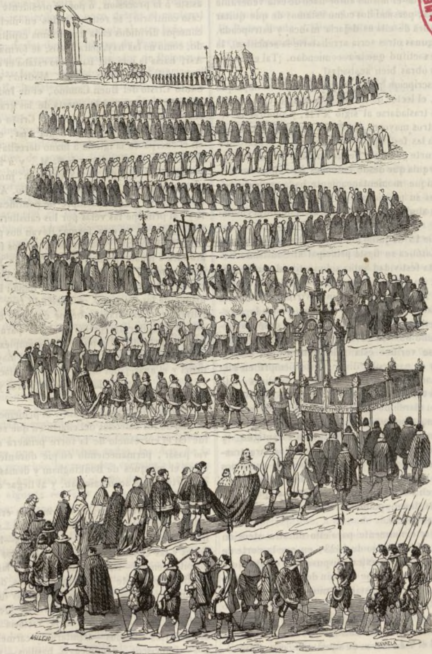
LA PROCESSION DEL CORPUS EN MADRID: AÑO 1623.