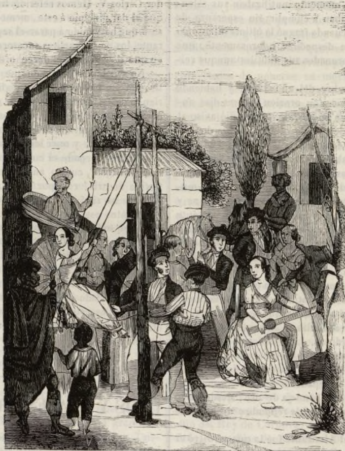
(Un Columpio en Sevilla.)

Guadaira , que lame sus muros, por el de la puerta principal está el sobredicho puente y el camino del arrabal de San Bernardo , que tambien conduce á las puertas de San Fernando y de La carne ; por detrás tiene una magnífica arboleda de higueras y de naranjos que concluye en la misma orilla del Guadalquivir, y al frente del