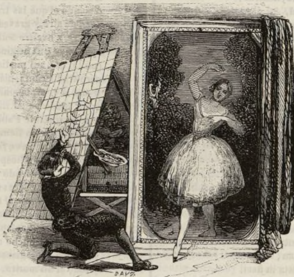
(Farfarella.—Acto 2.º—El delirio del Pintor. escena por la Guy Stephan y Petipá, hijo.)

.. Ha comenzado á ver la luz pública desde el lunes 7 del corriente, un periódico de modas y novedades con el título de Elegancia . Consta cada número de 8 páginas de hermosa impresion con cubierta de color y alternativamente un figurin de Paris, una pieza de música para canto ó piano, un pliego de labores y patrones y un retrato ó estampa. Con el título de Floresta literaria inserta escogidas producciones en verso y prosa.