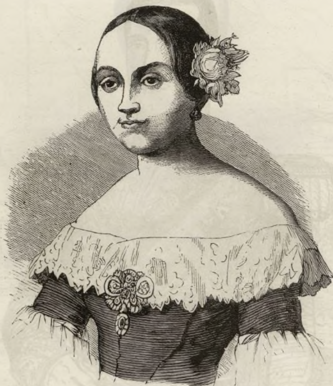
(S. A. R. la Infanta de España Doña María Luisa Fernanda, hermana de la Reina, nació en Madrid en 30 de Enero de 1832.)

guida, y ocupando el lugar acostumbrado, los oficiales mayores del real cuerpo de Alabarderos. El alcaide principal de palacio, que se hallará con todo lo necesario para el acto, se colocará á la derecha de la puerta de la saleta. A la izquierda de esta misma puerta se colocarán los individuos de la servidumbre y acompañamiento de los