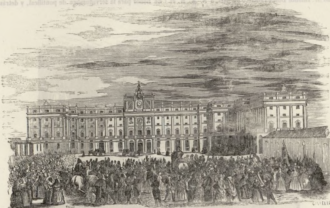
(Vista del Palacio de Madrid desde la Plazuela del Mediodía.)