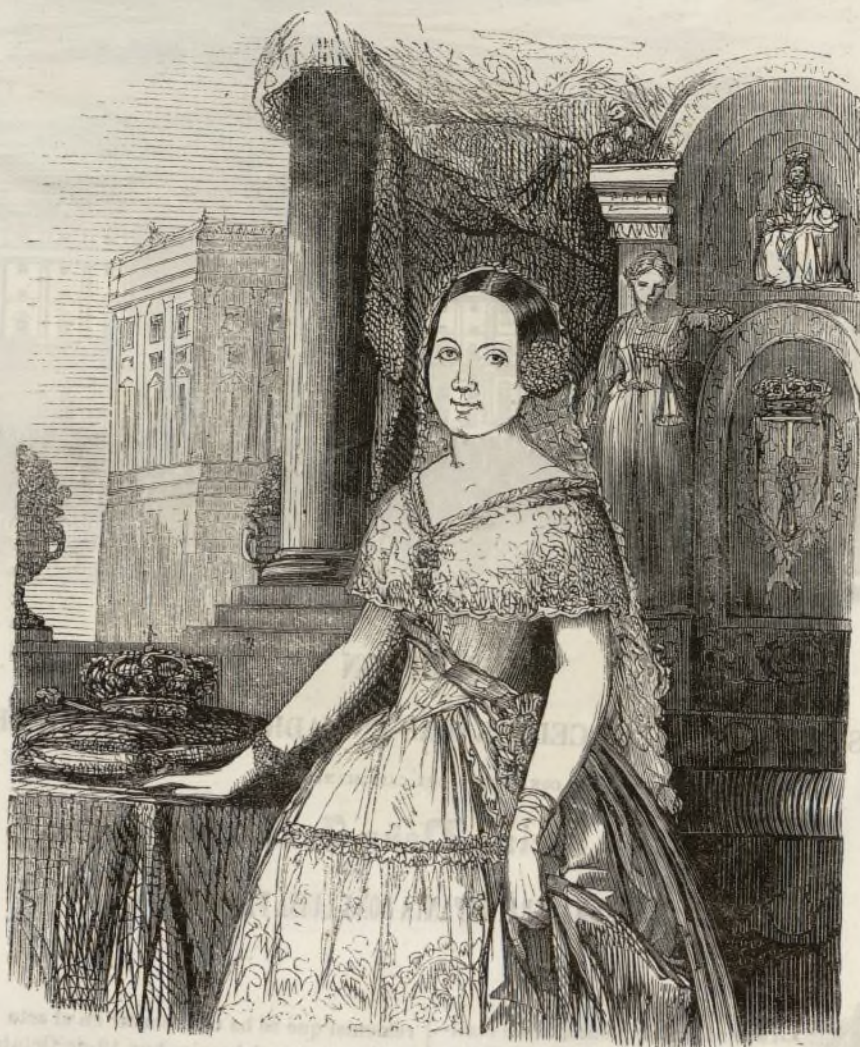
S. M. la Reina Doña Isabel II nació en Madrid en 10 de Octubre de 1830. Empezó su reinado en 29 de Setiembre de 1833. Fue proclamada Reina en Madrid en 24 de Octubre del mismo año.

A la izquierda del trono, y con la debida separacion, se colocará un altar con cruz, candeleros y frontal blanco, y sobre él se pondrán los ornamentos del prelado. A la izquierda de este altar se colocarán los seis capellanes de honor para la servidumbre de pontifical, y detrás al-