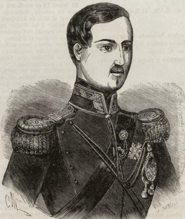
(S. A. R. D. Antonio María Felipe Luis, Duque de Montpensier, hijo menor del Rey de los franceses, nació en Neuilly en 31 de Julio de 1824.)

tuas enhorabuenas de las reales personas, se retirarán SS. MM. precedidas de la comitiva.