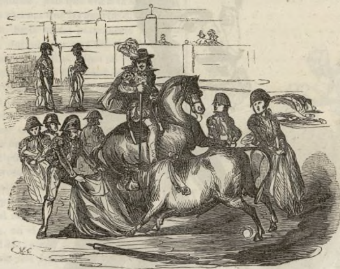
Suerte del rejoncillo.

El segundo que tiraba á berrendo en negro con divisa encarnada y blanca, de los señores duques de Osuna y Veraguas, era receloso y blando; el señor Romero le esperó próximo al toril y buscándole á caballo levantado, cuando escarmentado por los primeros rejoncillos no se prestaba el toro á recibir mas, le puso con particular de nuevo hasta nueve de estos, distinguiéndose siempre por su destreza y gallardía, su serenidad y su valor. El otro caballero que solo de cuando en cuando aparecía en la