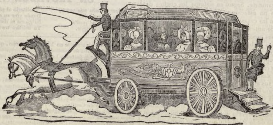
OMNIBUS DE LONDRES.

Se ha calculado que treinta mil personas disfrutan diariamente de este beneficio en aquella capital, y muy luego los inventores de los omnibus tuvieron que repartir sus ganancias con otras empresas del mismo género, que se reprodujeron bajo los nombres de Damas blancas , Favoritas , Orleanesas , Ciudadanas , Diligentes , Escocesas , Bañiolesas , Aceleradas , Bearnesas y Triciclos , las cuales surcan en todas direcciones aquella inmensa capital; mas no obstante esta concurrencia y haber llevado la comodidad hasta el punto de regalar á cada uno de los transeuntes un periódico de anuncios titulado el Gratis , (porque efectivamente nada se paga por él), han sido tales las ganancias de estas empresas que en el día suelen venderse las acciones de 1000 francos por el doble de su capital.