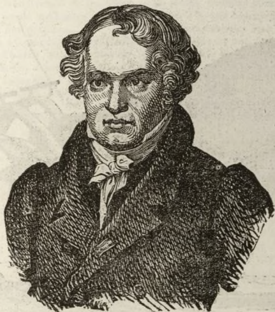
(Alejandro de Humboldt.)

fuerte resolucion, un grande amor á la ciencia para es- poner así su vida sin otro objeto que el de fijar una duda ó determinar la posicion de un punto sobre la superficie de la tierra.