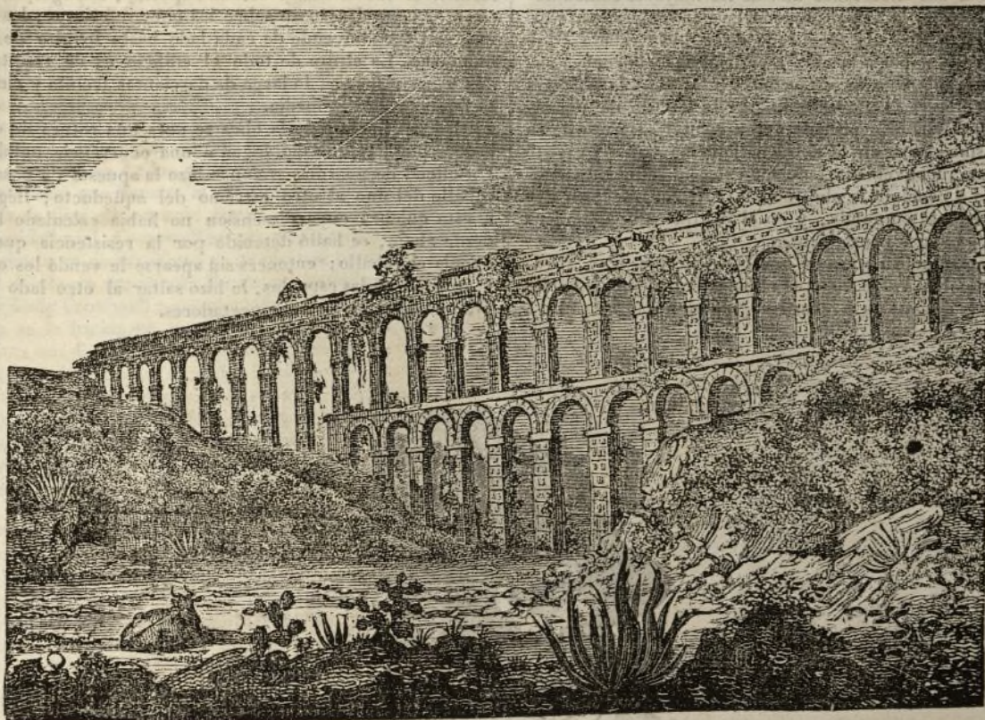
EL ACUEDUCTO DE TARRAGONA.

El agua es un objeto tan indispensable para la vida del hombre, que su presencia ha sido siempre la primera condicion para el establecimiento de todo grupo de poblacion social. Los lagos, los rios y fuentes naturales, han determinado el sitio de los pueblos mas importantes, y desde la mas remota antigüedad vemos á la industria humana empleada en hacer servir á sus ideas las corrientes de aguas naturales, ya variando su direccion, ya conteniendo su impetuosidad en ciertos límites. La civilizacion de la China comenzó al tiempo que las obras en el rio Amarillo; célebres son igualmente los trabajos de los antiguos en el Nilo y el Eufrates; y puede establecerse, en fin, que el poder que el hombre ejerce sobre el agua, sirve á conocer el que alcanza sobre toda la naturaleza, pues que sometido una vez á su voz, aquel agente principal puede con mas facilidad dominar el resto. El agua, le sirve, en efecto, ya para facilitar las comunicaciones y transportes, ya para fertilizar sus campiñas, ya en fin á rennir ó dispersar sus habitaciones en uno ó muchos puntos sin temor de la sed ni de la miseria de los frutos.