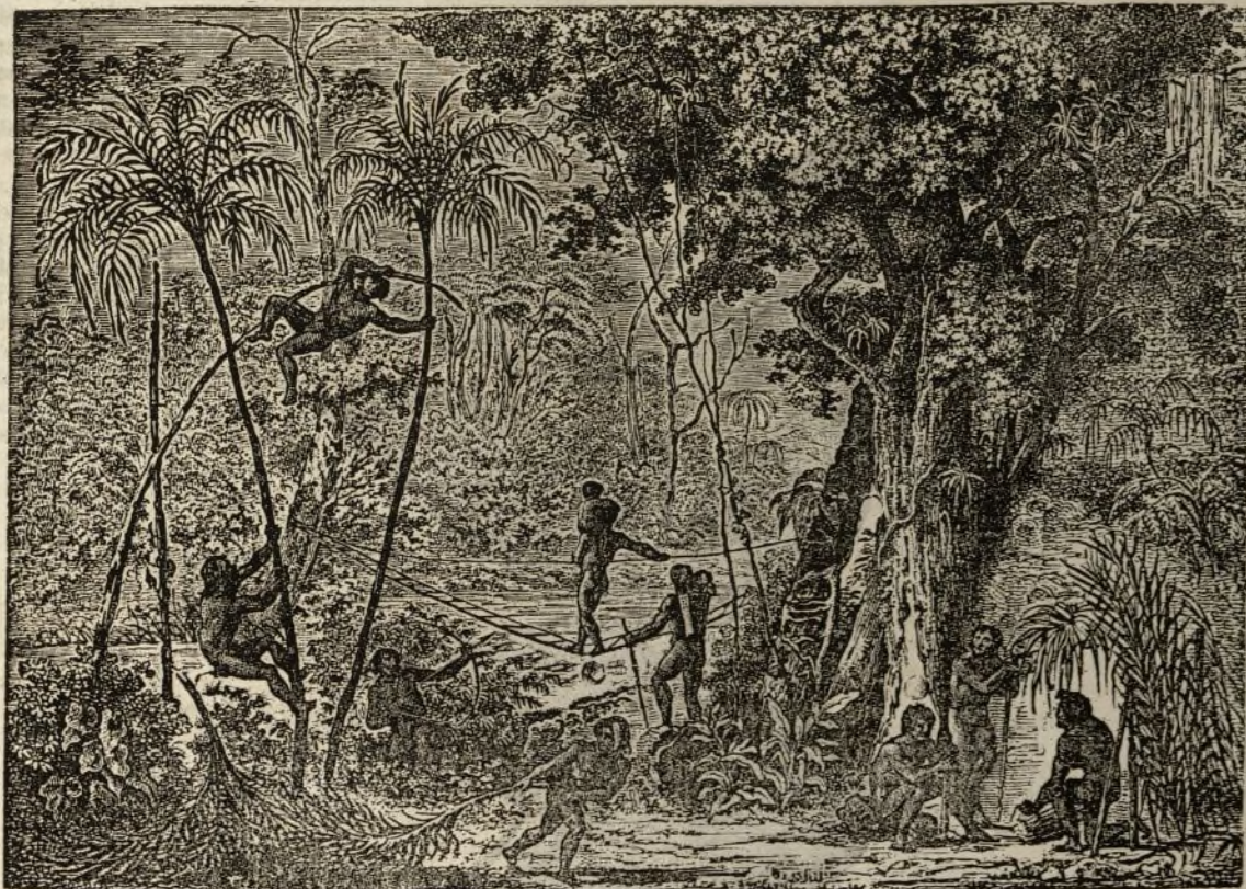
(El Puente de Lianas.)

ras que cargan las mujeres á la espalda, sujetándolo á la frente con una cuerda, de suerte que sufre la cabeza el mayor peso, y llevan ademas las provisiones y un par de hijos. Los hombres van delante sin otro peso que su arco y sus saetas: porque los mas fuertes por donde quiera oprimen á los mas débiles, y se aprovechan de su superioridad para distribuir los trabajos y goces del modo mas opuesto á la justicia y á la razon.