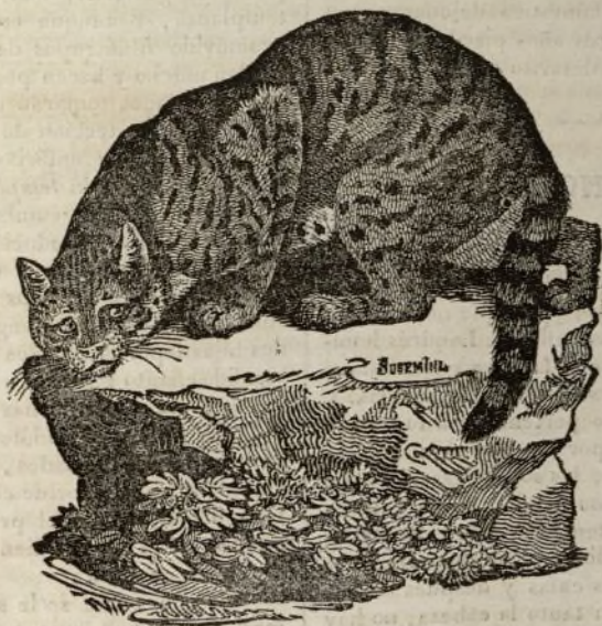
(El gato montés.)

Aunque el gato es un tipo único, presenta mucha variedad en cuanto á la piel, que es el resultado infalible de la mudanza de clima, de costumbres y de cuidados. Antes de entrar en algunos pormenores sobre este punto, hablaremos de la raza que constituye el tronco de las demas, y permanece siempre la misma, y es la del gato montés representado en el grabado adjunto.