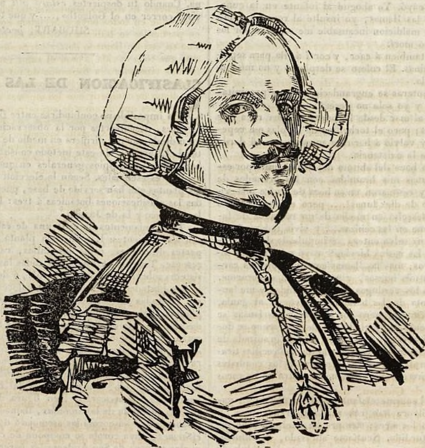
D. DIEGO DE VELAZQUEZ.

Tournefort había fraguado su sistema sobre la figura de la corola, y Lineo sobre la figura y disposición de los estambres y del pistilo, cuando Antonio de Jussieu publicó un método de clasificación mas ventajoso. No se funda solamente en las diferencias parciales que median entre las plantas, sino sobre la diferencia de todas sus partes principales. Esta circunstancia hace mas apreciable la clasificación de Jussieu, porque conduce al conocimiento de la naturaleza de la planta, siendo así que por los otros dos sistemas no se consigue sino el conocer algunas de sus diferencias. Jussieu establece quince clases de plantas: cada una de estas clases se divide en un número mayor ó menor de órdenes que constituyen lo que se llama segun él familias de plantas . Por lo demas, estas familias representan los órdenes de plantas en que Tournefort y Lineo dividieron sus clases; y estos órdenes en las tres clasificaciones que acabamos de explicar conducen á otras subdivisiones, y á los géneros y especies, hasta el conocimiento de cada individuo.