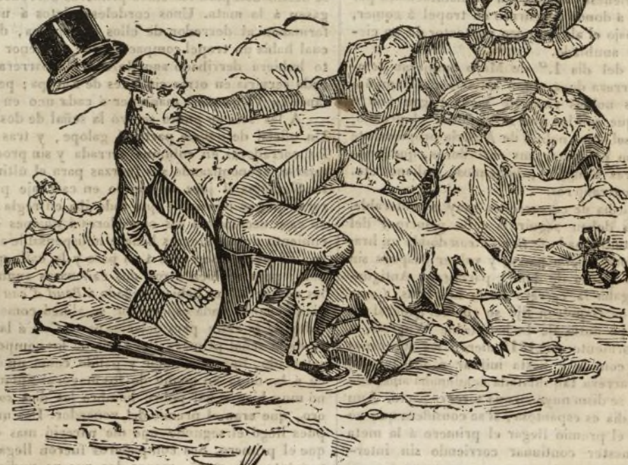
UN PASEO INTERRUPTO.

A cosa de las cinco subieron las señoras á sus coches, dirigiéndose á la grande calle del Prater en donde empezaba el paseo. Dos grandes hileras de elegantes carruajes circulaban por ambos lados, dejando el medio para los de cuatro caballos: el contrapaseo de la derecha es para los de á caballo, y el de la izquierda para la gente de á pie; pero lo que no puede imaginarse quien no la haya visto es la belleza de los sitios de este paseo; el admirable verdor de los árboles, los dilatados prados que los rodean, la embalsamada frescura del ambiente, y la diversidad de equipages rusos, húngaros, polacos que van pasando sucesivamente por delante de uno. Al ponerse el sol cada uno se retira; el Prater va quedando poco á poco desierto, y la muchedumbre que le llenaba se encamina hacia los infinitos gasthauser de Viena y sus arrabales para acabar de celebrar dignamente con el vaso en la mano el primer día del mes de Mayo aguardado con tanta impaciencia, y tan cordialmente solemnizado.