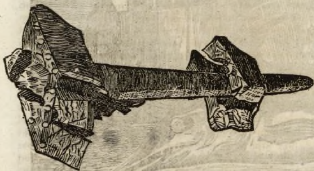
(Las embestidas del pez espada contra los navios son tan violentas, que puede atravesar el bordaje ó costado del buque. El dibujo que aqui se pone manifiesta un trozo así atravesado que se encontró en la carena de una fragata.)

La costa calabresa tendrá unas cinco leguas hasta Regio, y su aspecto es severo: se acumulan en ella, no colinas sino montes que reflejan un viso de amatiste por que la luz se descompone allí en un aire puro,