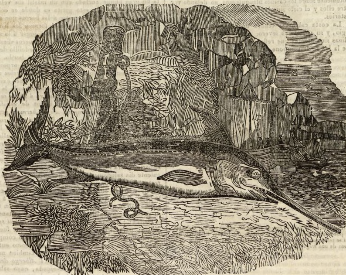
EL PEZ ESPADA.

4.º En cuanto al esfuerzo ó celeridad que el hombre puede producir tirando ó impeliendo con el brazo, es sabido que en circunstancias las mas favorables no debe prometerse trabajando continuamente un esfuerzo que escenda del valor de treinta y dos libras, elevados en un segundo á medio pie de altura.